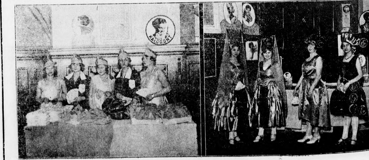
Bocskay bátról. Jelmezes elárústitó hölgyek

A rendeletben foglaltak szerint a mezőgazdasági jövedelmének megállapítása során a termények értékét pénzre átszámítva és pedig a felhasználás idejében meg volt: helyi értékben, illetve az eladás folytán értékesített terményeket: az ezekért tényleg kapott pénztértekben, az év végén meglévő készleteket pedig: az év végén volt helyi forgalmi értékben (piaci áron) kell az egyéb kész-