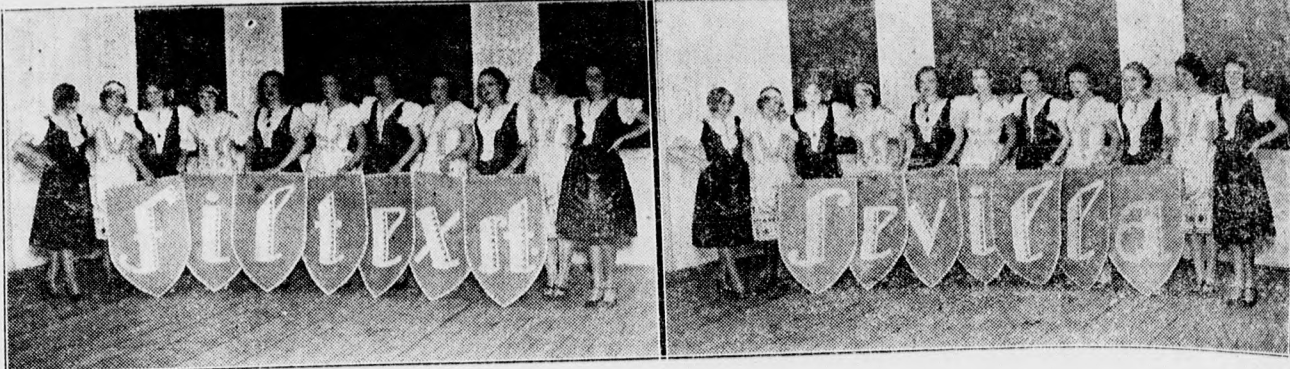
A Bocskay bál Filtext Sevilla görleji.

Az 1929-es év csapásaitól elalélt ipar és különösen a mindennapi megélhetésért küz-