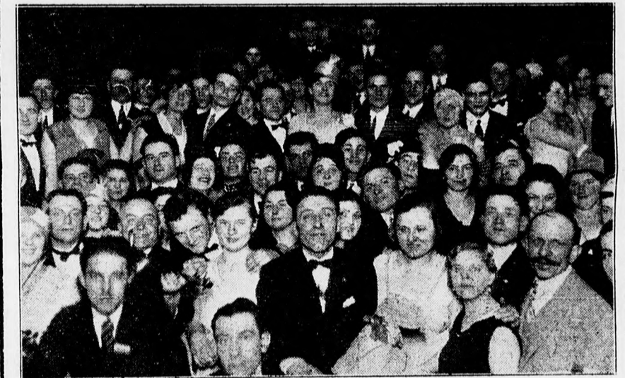
A hentes és mészáros ifjak jól sikerült bálja a Royalban. A közönség egy része.