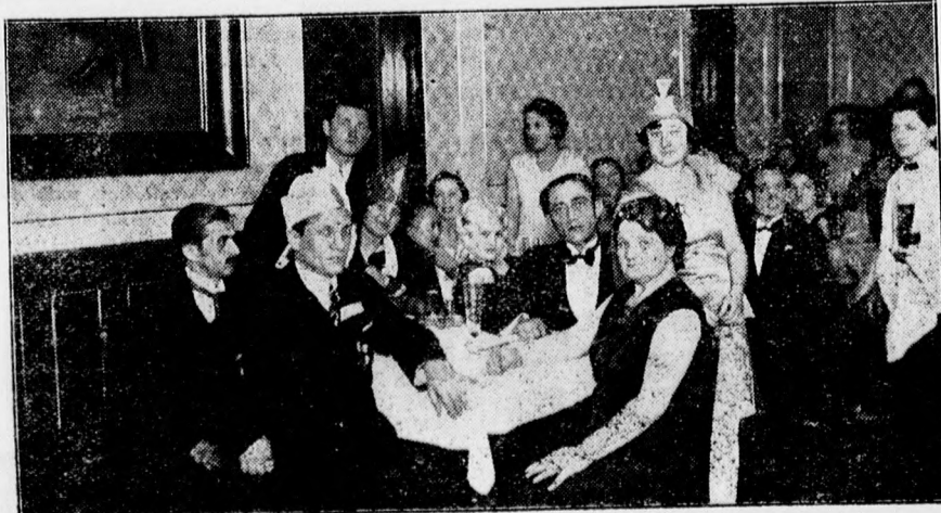
A női Iodrászoknak az Angol Királynőben tartott pompásan sikerült bálja közönségének egy csoportja.