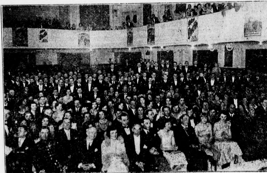
A Bocskay bál közönségének egyrésze a műsor alatt.