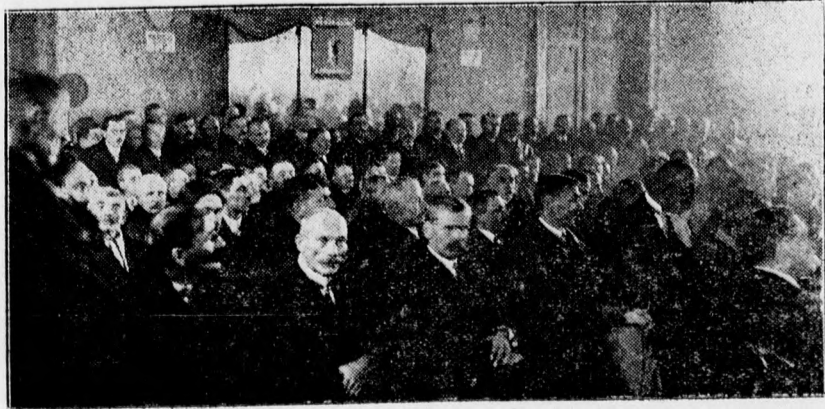
Az iparosgyűlés résztvevőinek egy része.

egészség és közbiztonság érdekében használatlan sürgőségi munkálatok (pl. dűledező falak, kerítések, kapuk, tetők kijavítása, továbbá ott, ahol már vannak, de a talált állapotban meg nem felelőnek vélemezett closette-ek, bádor- és vízesatornák stb.) elvégzésére;