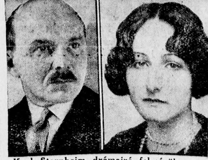
Karl Sternheim drámaíró feleségül vette Pamela Wedekind-et, Wedekind leányát.

A Magyar Birkozó Szövetség kelet-magyarországi kerületéhez tartozó egyesületek még pedig a Debreceni Torna Egylet, Debreceni Egyetemi Atlétikai Club, Debreceni Vasutas Sport Club, Debreceni Munkás Testező Egylet, Karczagi MOVE Sport Egyesület és a Püspökladányi Levente Sport Egylet közös rendezésben lebonyolították február hó 23. napján, vasárnap a DTE tornacsarnokában délután 4 órai kezdettel a kerületi birkozó csapatbajnokságokat. Ezen bajnokságok teljes lebonyolítása négy vasárnapot vesz igénybe, úgy hogy a versenyek a fenti napon kívül a következő napokon fognak még lebonyolítani: március 2—9. és 16 napjain. A fenti versenyekre az egyesületek már a legnagyobb előkészületeket megtették és így a versenyek sikere biztosítva van. A fenti egyesületek a legjobb versenyzőiket indítják, hogy maguknak biztosítsák a büszke kerületi bajnoki címet, amelyet — ismerve a kerületi