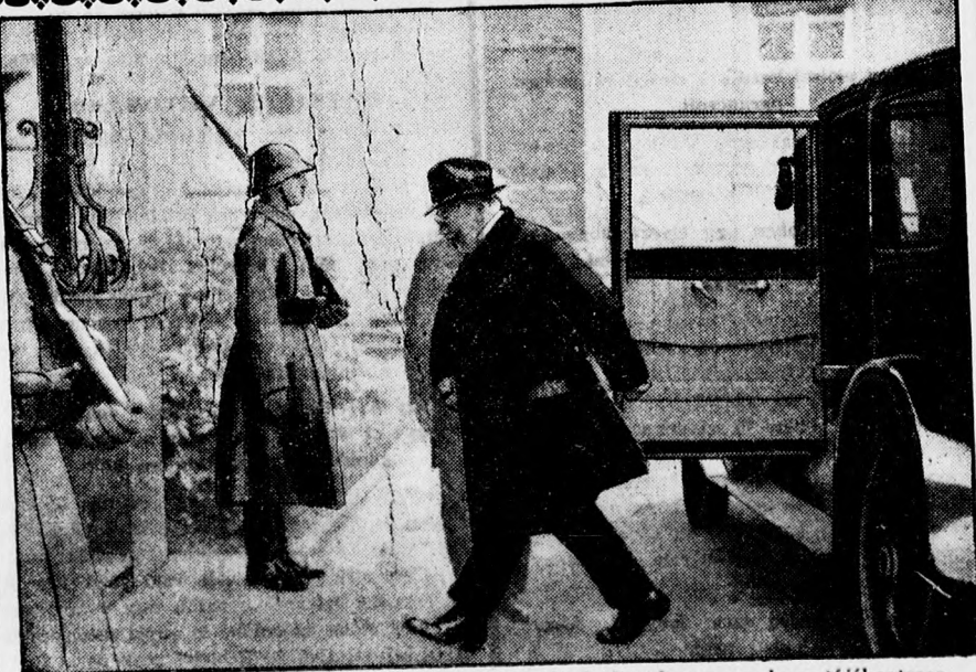
Hugenberg, a német jobboldali ellenzék vezére Hindenburghoz megy, hogy tájékoztassa pártjának álláspontja felől a Young-tervvel szemben.

Az est úgy anyagilag, mint erkölcsileg teljesen sikertelt.