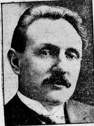
Chautemps, az új francia miniszterelnök.

A kormány, — a kebelében képviselt pártcsoportok számára alapján — körülbelül 190 szavazattal rendelkezik és ha a szocialisták támogatják, ez a támogatás további 100 szavazatot jelent számára. Bemutatkozásakor tehát csak akkor számíthat többségre, ha a közvépártok részéről, többen tartózkodnak a szavazástól.