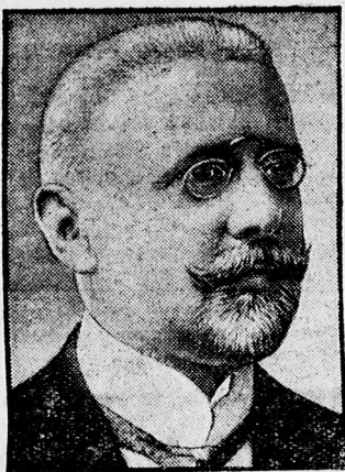
Schober osztrák kancellár.

Schober kancellár megérkezése után meglátogatta Müller kancellárt, akinél rövid ideig tartó udvariassági látogatást tett. Utána Curtius külügyminisztert kereste fel. Háromnegyedegy óraker Schober Hindenburg elnök fogadta. Az elnöki fogadás után Hindenburg Schober kancellárt dezsómén látta vendégül.