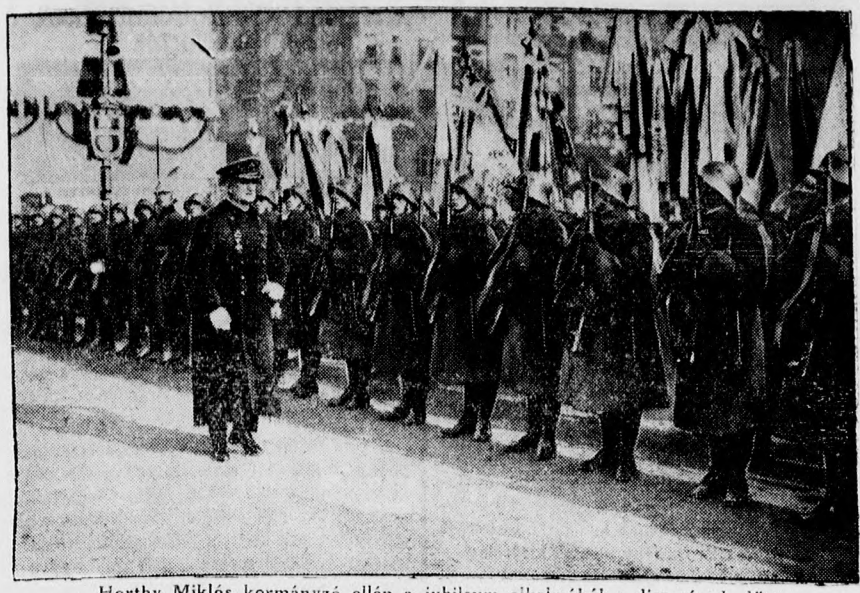
Horthy Miklós kormányzó ellép a jubileum alkalmából a díszszázad előtt.