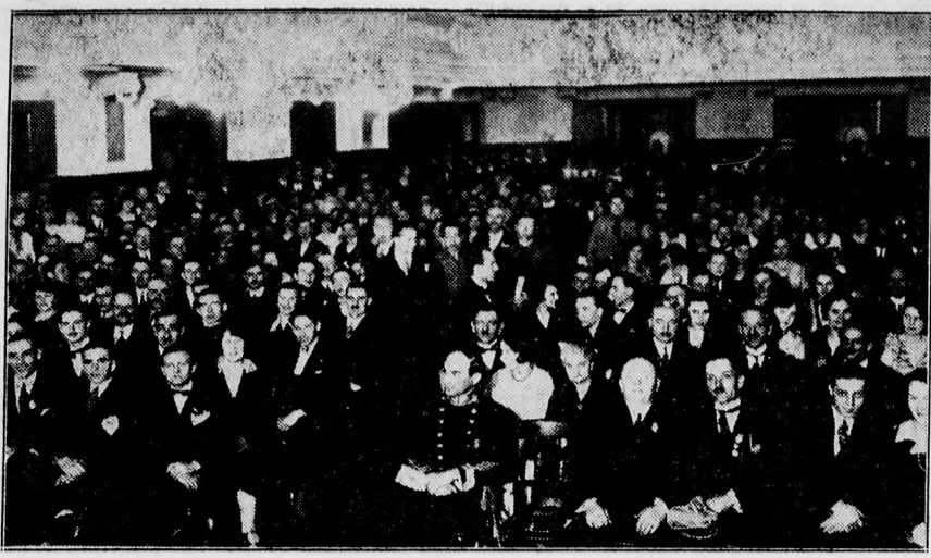
A dalárdák hangversenye az Arany Bika nagytermében. A hallgatóság.