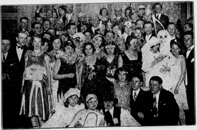
A Függetlenségi Kör fényesen sikerült álarcsbálja közönségének egy része.

Meg kell állapítanunk, hogy a szükséglet pótló intézkedés rendkívül népszerű lett. Vasárnap már