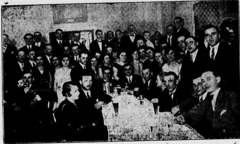
A gépkocsivezetők szépen sikerült báljának közönsége.