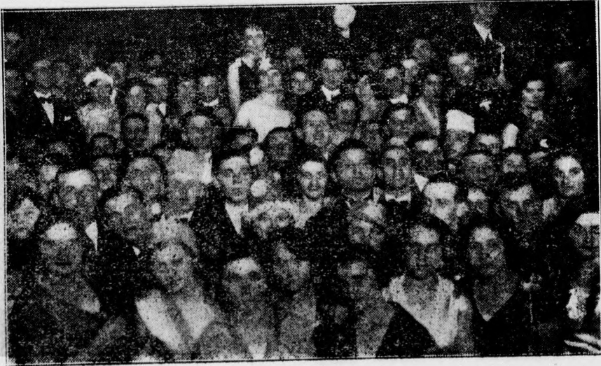
Postaalkotók mulatójának közönsége.

Minden idők legjobb lemeze, filmje, papírja az angol „Ilford”!