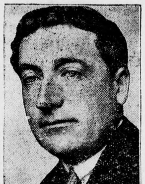
Jules Romain, a világhírű francia író most európai körúton felolvasást tart Németországban.

A DEBRECENI FÜGGETLEN UJSÁG újabb riportfelvételei ismét láthatók a „Friczi” kalapszalonn kirakataiban.