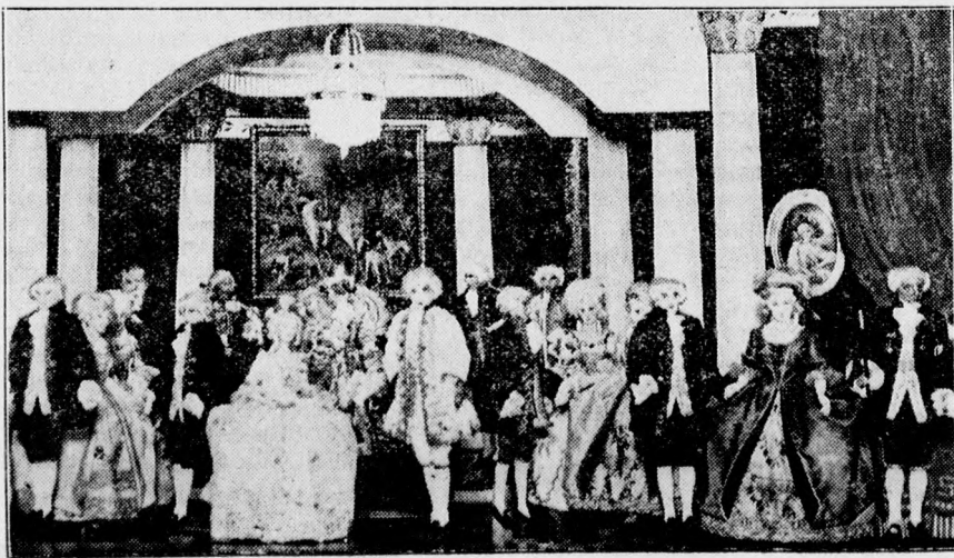
A debreceni izraelita nőegylet által rendezett művészi bábszínház színpada.

Az újabb ajánlatok beadásának határideje szerdán déli 12 órakor járt le. Eddig az ideig, mint a multkor, most is csak egy ajánlat érkezett be, mert a felhívott intézetek közül négy nemleges választ adott. Déli fél 12 óra-