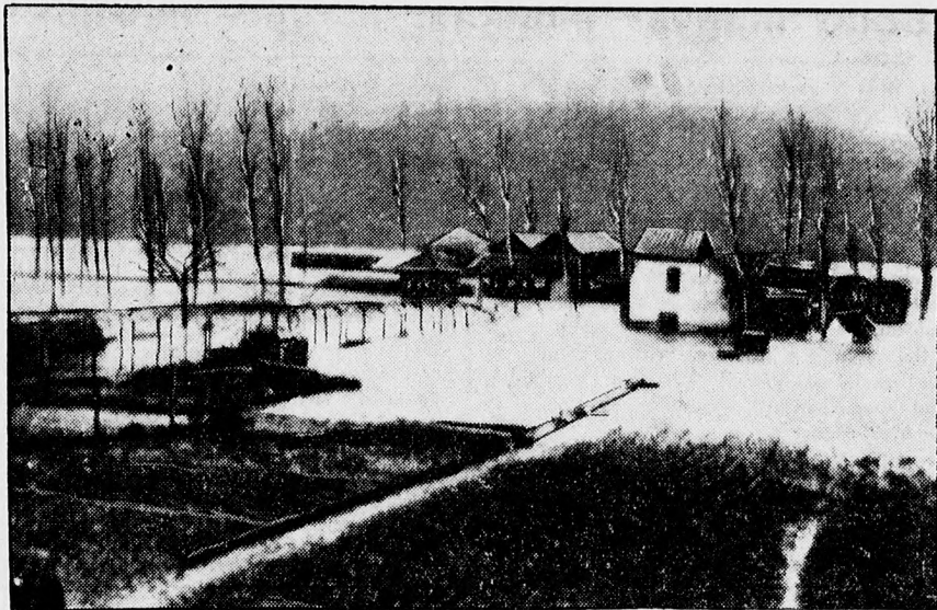
Első fényképfelvétel a délfranciaországi árvizről. — Egy elöntött pireneusi falu.

Tömegesen érkeznek adományok a külföld- ről is. Nunciusa utján XI. Pius pápa részvétét fejte ki a külügyminisztériumnak és a ká- rosultaknak 100,000 frankot küldött. Musso- lini 25,000 frankot küldött az árvizkárosultak javára.