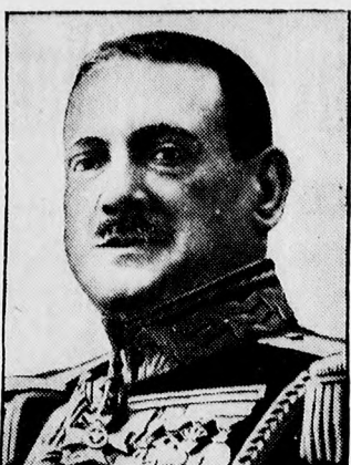
Anido generalis, akit Berenguer spanyol miniszterelnök utódként emlegetnek.

— Az összes megjelenő szépirodalmi ajándékok, tudományos és ifjúsági könyvek a megjelenés után azonnal kaphatók a Debreceni Független Újság Kölcsonkönyvtárában.