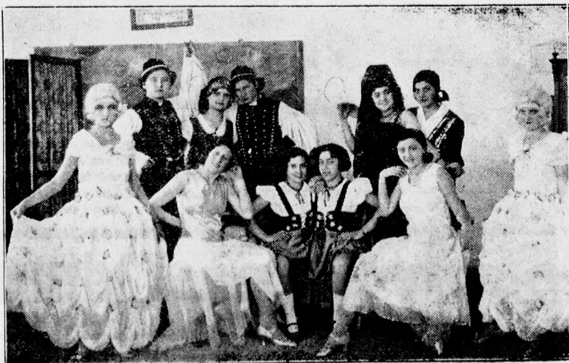
A nőpariskola műkedvelő előadása. — Az előkép szereplői.

A rendőrség a feljelentés értelmében a nyomozást megindította a vakmerő tolvaj kézrekerítésére.