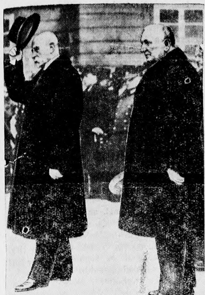
Massaryk, Csehszlovákia elnöke, a katonai diszmenetet nézi. Háta mögött Wiskowszky hadügyminiszter.