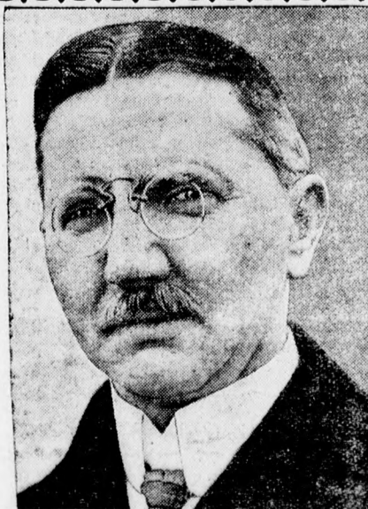
Dr. Hjalmar Schacht lemondott a Német Birodalmi Bank elnökségéről, mert a hágai megegyezés ellentétbe jutott a kormányzattal.