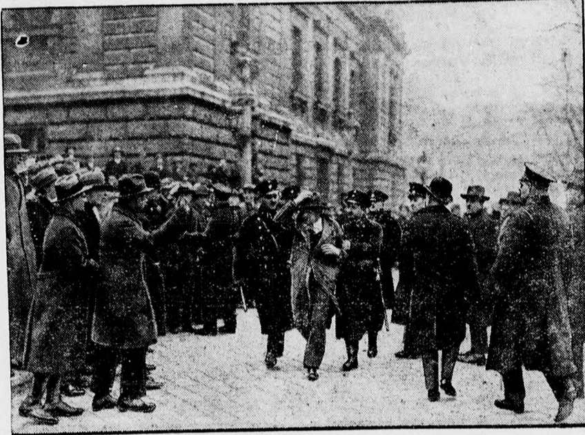
A bécsi „vörös nap”. A rendőrség letartóztat egy kommunistát.

Höfer gyermekhintőpor gyermekkezem gyermekszappan LESZÁRÍTJA A KIÜTÉSEKET, MEGSZÜNTETI A BŐR VÉRŐSSÉGÉT. PATIKÁBAN, DROGÉRIÁBAN, ILLATSZERTÁRBAN KAPHATÓ.