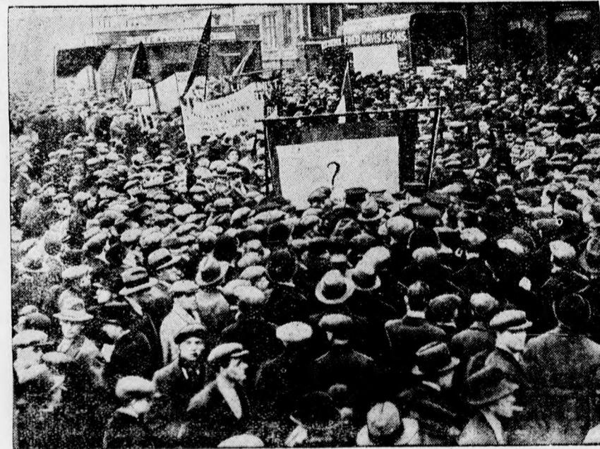
A „vörös nap” Londonban. Tömegfelvonulás az uccán. A rendőrség felkészültsége itt is megakadályozott minden rendezvényt.

Nem kevesebb, mint 12.000 tanuló járt eddig ebben az iskolában s közülük igen sokan tekintélyes pozícióba kerültek, ami a tanári kar oktatói és nevelői munkájának értékét igazolja. Ezen a munkán felül majdnem minden tagja élénk egyházi és társadalmi tevékenységet is fejt ki. Hangsúlyozza az emlékirat, hogy az elhelyezés sem okozna különösebb gondot, mert „tárgyalások folytán bizonyosan is elérhető volna, hogy az iskolának helyet sem kellene változtatni, minthogy a város a Kereskedő Társulatot iskolalapításában is jelentősen támogatta.” Az anyagiak terén sem merülne fel nehézségek, mert hiszen a jelenlegi tanárok fizetéskiegészítő államszegélyüket teljes egészében magukkal vinnék át, a másik részét az egyéb dologiakat pedig bizonyára fedezné nagyrésztben a befolyó tandíj, mert kétségen felül áll az, hogy ha Debrecen városa venné át ennek az iskolának a fenntartását, ez az ország legnépesebb polgári fiúiskolájává nőne ki magát. „Ekképen elintéztést nyerhetne a nevelői és tanítói munkában kipróbált tanároknak a sorsa és a város is gyakorlott oktatói kart mondhatna magának” — fejezi be a memo-