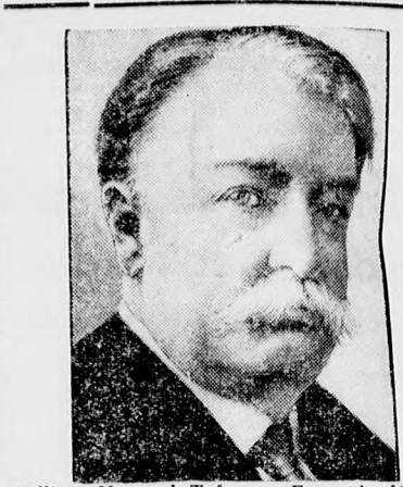
William Howard Taft, az Egyesült Államok 1909-1913. időszakban volt elnöke, legutóbb a legfelsőbb bíróság elnöke, meghalt 73 éves korában.

A Debreceni Független Újságot példányonként vásároló 25 szelvény és 1 pengő