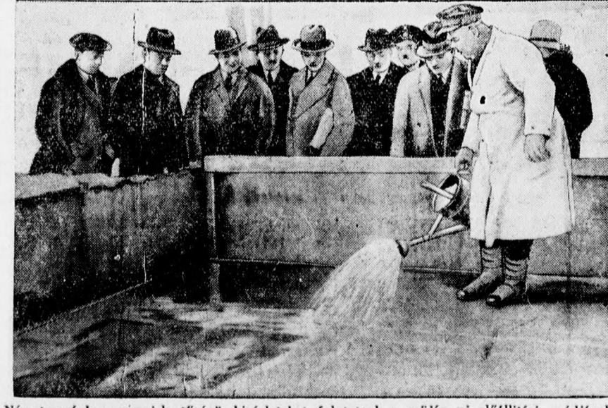
Németországban nagyjelentőségű kísérleteket folytatnak a műjég új előállítási módjával.