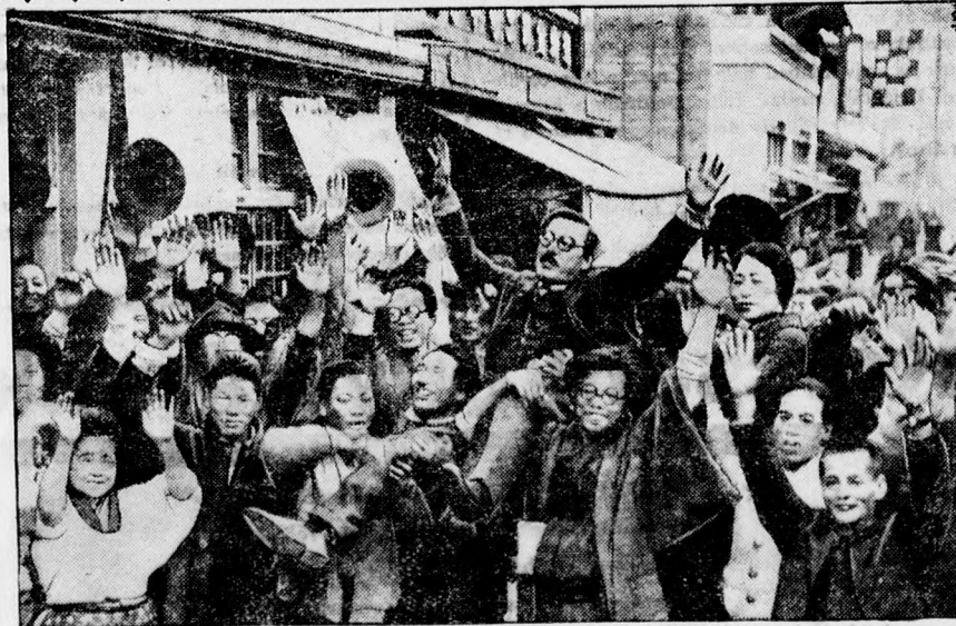
Kép a japán választásokból. A győztes jelöltet banzaj (éljen) kiáltások közben a választók vállakon viszik végig a városban.

A Debreceni Független Újság előfizetői és példányonként vásárlói jelentős kedvezményrel használhatják a Debreceni Független Újság Kölcsonkönyvtárát.