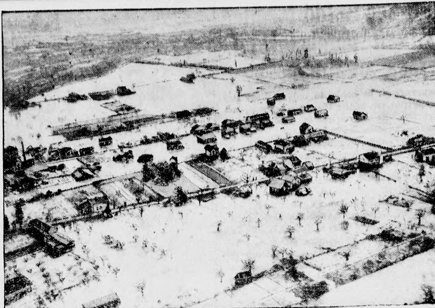
Repülőgép felvétel az árvíz lepte francia vidékről. Messze kilométerekre előntötte az ár a házakat, templomokat, utakat és földeket. Ez a legnagyobb árvíz, amely Európában pusztított.