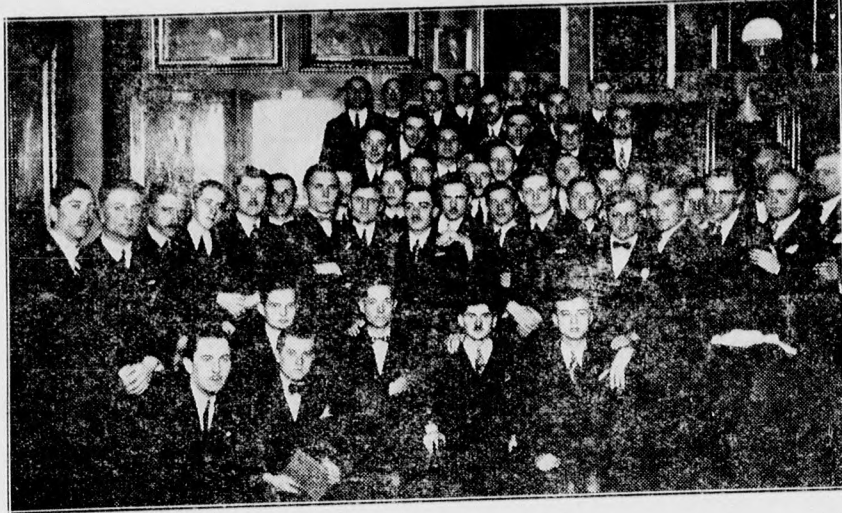
A debreceni Kántus.