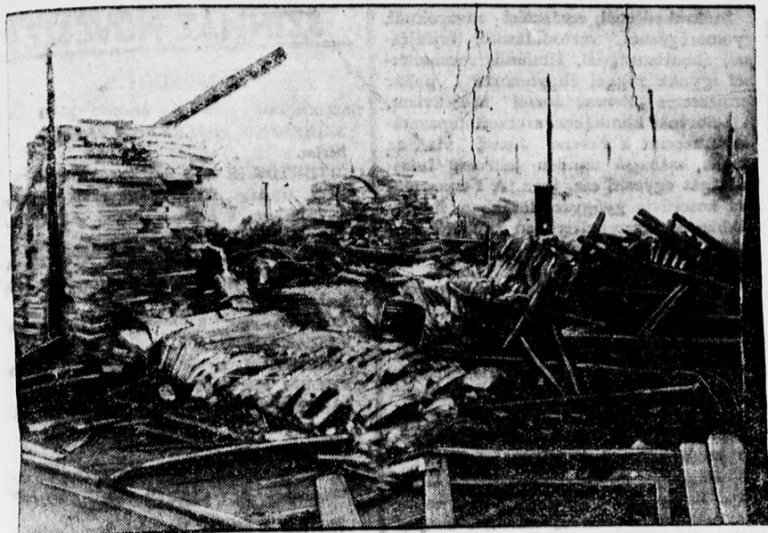
A berlini Westbahnhofon nagy tűz pusztított. — Az elégett vasuti raktárak egy része.