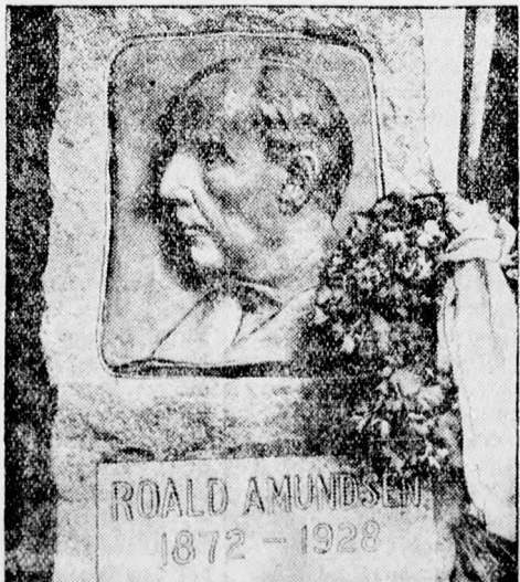
Emléktábla Roald Amundsen tiszteletére, aki a Nobile expedició kutatása alkalmával elpusztult. A táblát San Franciscóban állították föl Golden Gate Parkban a norvég kolónia tagjai.