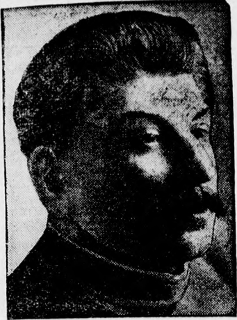
Stalin, Szovjetország diktátora, aki most állítólag lemondott.