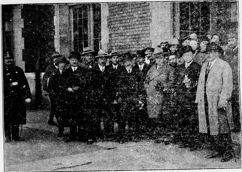
A Pro Palesztina Szövetség debreceni csoportjának megalakulására jött palesztinai és budapesti vendégek fogadása a debreceni pályaudvaron.