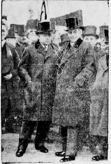
Moldenhauer és Curtius német miniszterek.

konferencia, talán itt volna az ideje, hogy tájékoztasson a kormány bennünket az ezzel kapcsolatos kérdésekről. Ami ebben a parlamentben folyik, az nem törvényhozói munka, hónapok óta rágódunk a fővárosi javaslaton.