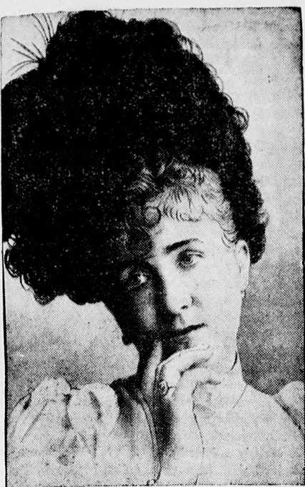
Schratt Katalin arcképe fénykorából. A mű- vésznő, aki hosszú ideig barátja és bizal- masa volt Ferenc Józsefnek, most elkeser- edett harcot folytat egy amerikai újság ellen, amely emlékeztetéseket közöl az ő neve alatt, pedig ő ilyeneket sohasem írt és ilyeneket a nyilvánosság elé hozni nem is akar.