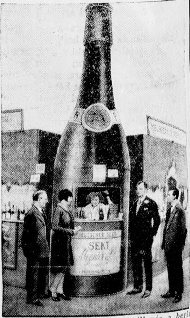
Egy pezsgőgyáros reklámpavillonja a berlini vendéglőskiallításán.