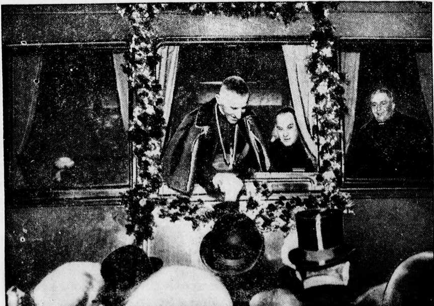
Orsenigo Cesare volt budapesti pápai nuncius bucsuja a budapesti pályaudvaron. A pápai nuncius új székhelye Berlin.

A választást intéző bizottság az iparosság- hoz a következő felhívást bocsátotta ki: