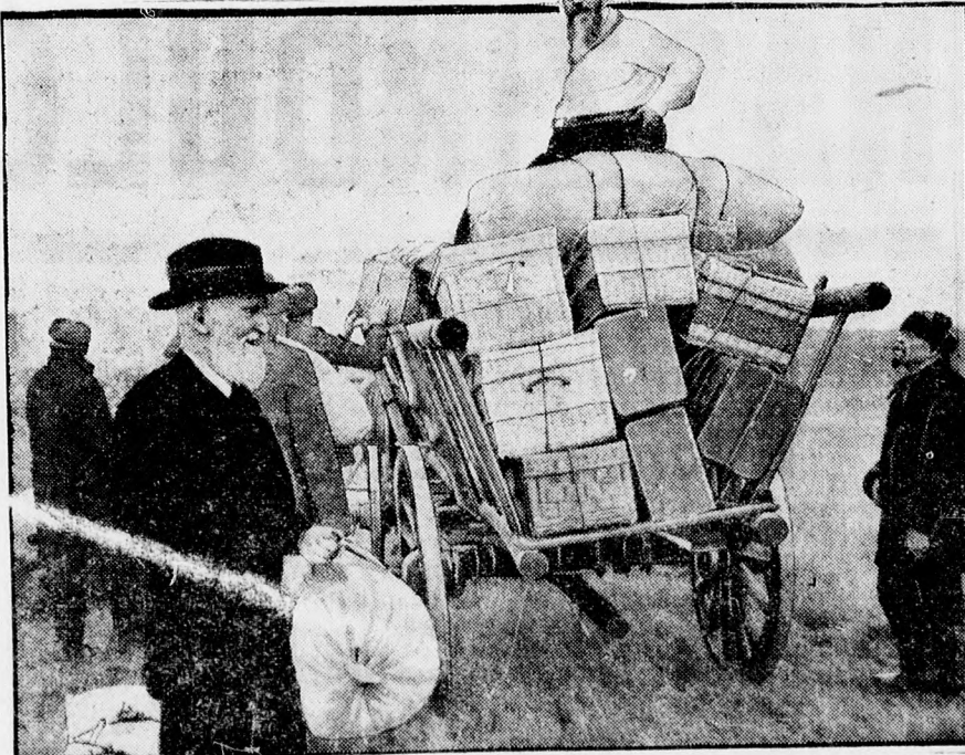
Április 1-én kezdik meg Robinzon-életüket Galapagos szigetén (balról jobbra): Bernhard Shaw, Zeileiss professzor és Trockij.