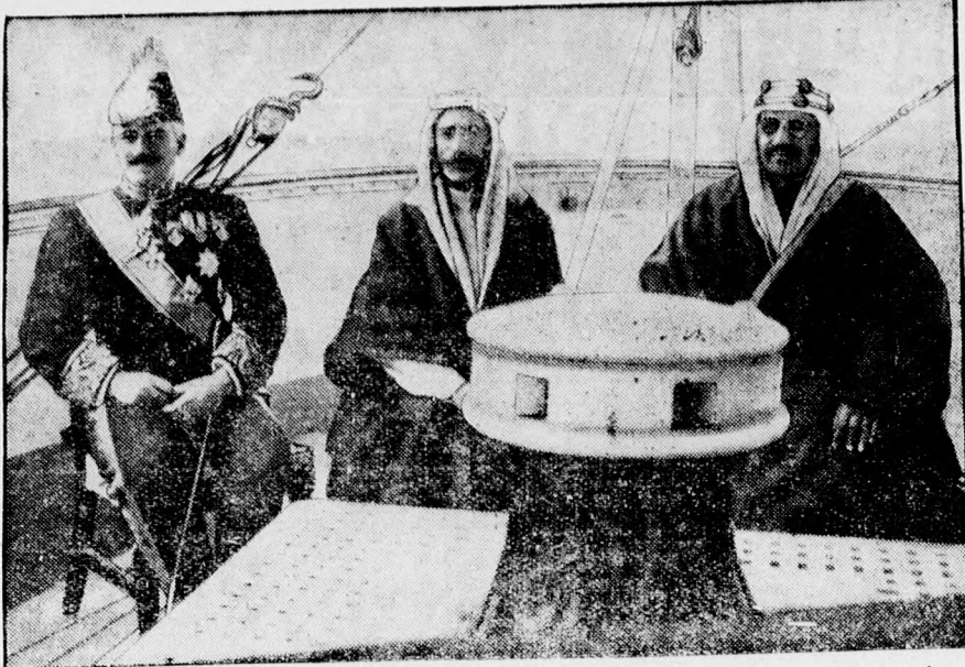
A béke megkötött az arab uralkodók között. Balról jobbra: Mezopotámia angol kormány- zója: Sir Hunphrys, Faisal — Irak és Ibn Saud — Hedsas királya.

A DEBRECENI FÜGGETLEN ÚJSÁG újabb riportfelvételei ismét látha- tók a „Friczi” kalapszalonn kirakataiban.