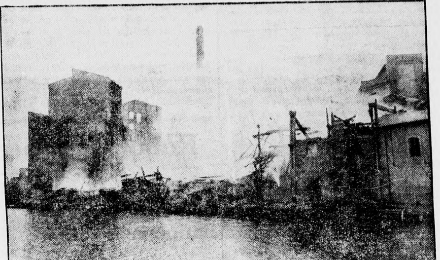
Leégett Németország egyik legnagyobb malma Eberswalde-ban. Az anyagi kár meghaladja a kétmillió márkát.

A horogkeresztesek, akik a kormány ellen intézett támadásikba az utóbbi időben egyre sürűbben belevonják a köztársasági elnök személyét is, a Young-szerződés aláírása után végképp félredobták minden szordinót s most már egész nyíltan — és példátlan hangemben — támadják Hindenburgot. A frontarcosok szövetségének épületében megtartott legutóbbi gyűlésükön Göring birodalmi gyűlési képviselő „ismertette” a Young-szerződés elfogadásának és aláírásának körülményeit s Hindenburg manifesztumával kapcsolatban többek között a következőket jelentette ki: — Nemesak a német nemzetiek és a néppártiak, de a centrum széles köreiben is hajlandóság mutatkozott a Young-tervezet elvetésére. Ekkor azonban az történt, hogy a birodalmi elnök személyesen beleavatkozott az ügybe és tekintélyével annyira imponált a centrumnak, hogy a szavazásnál igennel szavazott. Ez hát a birodalmi elnök. (Közbekiáltások: Áruló!) Ő tépet el minden érzelmi fonalat, amely egykor hozzánk fűzte, az álarc lehullott, az egyetlen érzés, amellyel a jövőben iránta viseltetünk, a gyűlölet. Hindenburg megszűnt férfi, tisztelretreméltó személyiség lenni! Most már mindenkinek