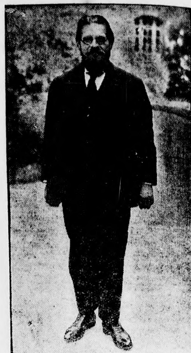
Albert Thomas, a Nemzetközi Munkaügyi Hivatal igazgatója.

Ez nem lázadzik, szidhatják, pofozhatják, nem kér fizetésemelést, nem lop, nem kell kimenőt