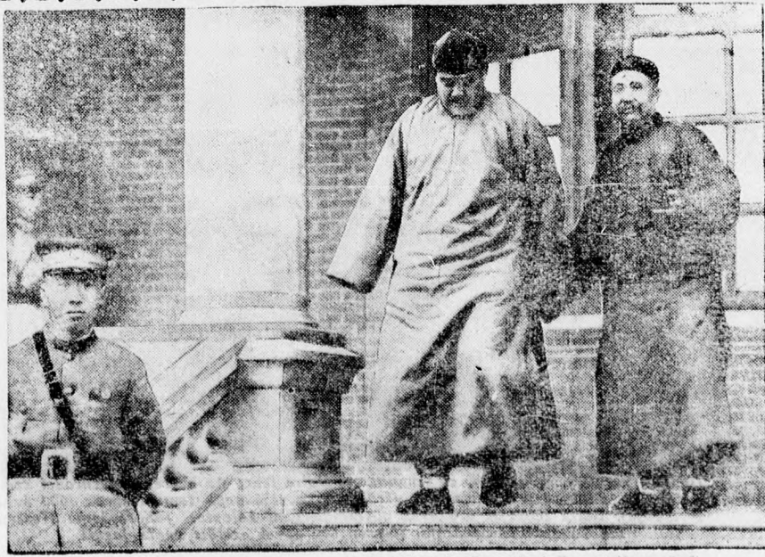
A forrongó Kina új urai: Feng Ju Hsiang és Fen Hsi Fang tábornokok.

hanyagthomlok rohantak, egymást taposva, a szélrózsa minden irányában. Aki nem futottak elég gyorsan, vagy megsebesülve lemaradtak, azokat a rendőrök bekisérték a kapitányságra.