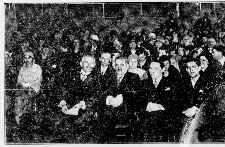
A ref. tanítóképző Csokonai ének- és zenekara és a ref. tanítói vegyeskar hangversenye közönségének egy része.

tiszteletteljes szeretete, a gondolatok izléses és áhítatos szövése, itt-ott korszerű magyar motívumokkal ékesítve; de szolid harmonizálás és öntudatos szilajság ott is, ahol a „helyénvaló” szenvedély másnak költői szabadságot engedélyezze. Ezekben a kompozíciókban Brück Gyula zenei eszményei hiánytalanul feltalálhatók és ezek az eszmények tiszták és mindenekelőtt hivatottak voltak arra, hogy a mester szándékait a tanítvány egyéniségébe szinte észrevétlenül átplántálják. Ha a zeneesztétika ismerné a „tanító költemény” fogalmát, Brück Gyula korszerű kis kompozíciói, a szemléltető szándékot eláruló „címes” darabok, a „valse”-k, „improptuk” és „concertek” joggal viselhetnék a didaktikus műfaj címét, hiszen mindegyik külön-külön, egyszerűségében és igénytelenségében is valóságos stílus-iskola, annak a stílusnak az iskolája, amikor a muzsikálás valóban szinte még stílus-kérdés volt és amikor egy-egy muzsikuss-zenei egyéniséce teljesen le tudja nyitni a korát, „stílust” tudott teremteni.