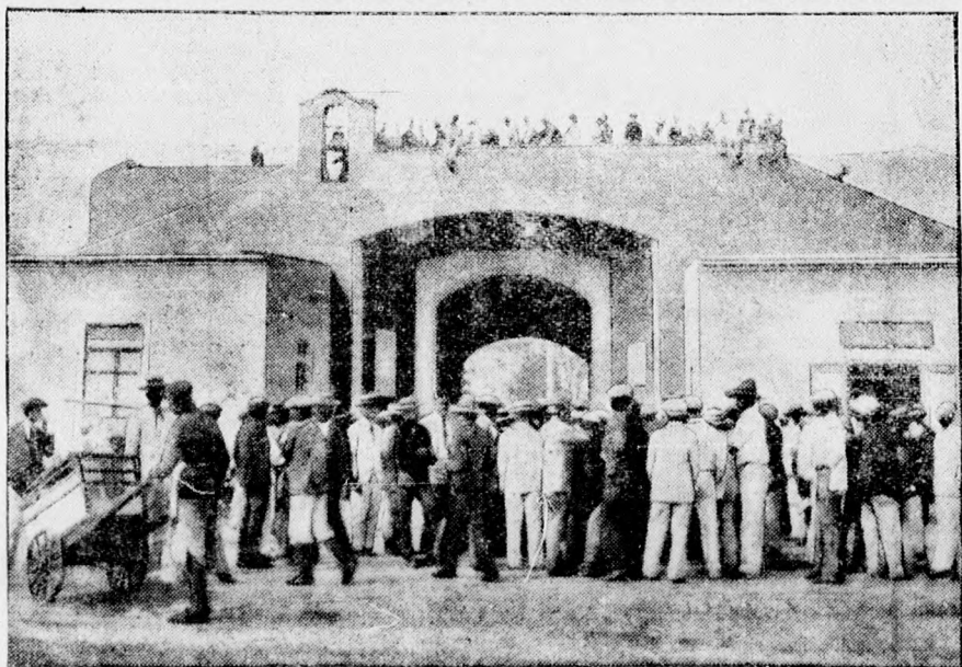
Pillanatfelvétel a sandomingoi (Haiti) vértelen forradalomról. A csöcselék lemondásra kényszerítette Vasquez elnököt és Urena tábornokot ültette helyébe.