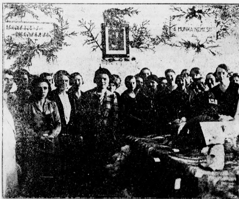
A II. számú gazdasági népiszkola vizsgakiállítás. — A kézimunka tanfolyam végzett növendékei.

Járok-kelek a hindu városka uccán. Fejem az a nemzetközi divatu fehér sisak,