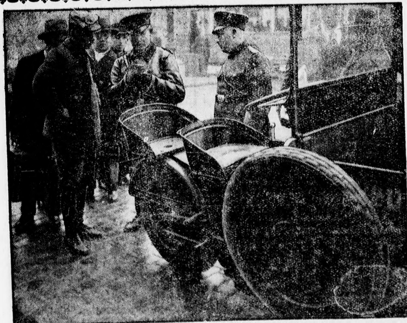
Berlin küzd a lárma ellen. Berlini rendőrkülönítmény igazoltat egy triciklvezetőt, aki nyitott kipuffogóval hajtott.