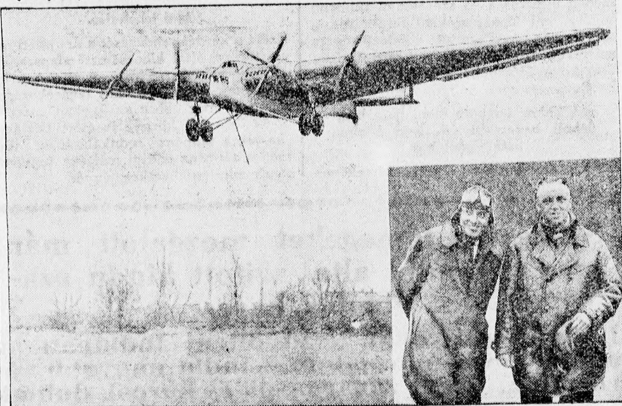
A G. 32 nevű óriás Junkers-gép újabb eredményes próbarepülést végzett. Bal-sarokban a pilóták.