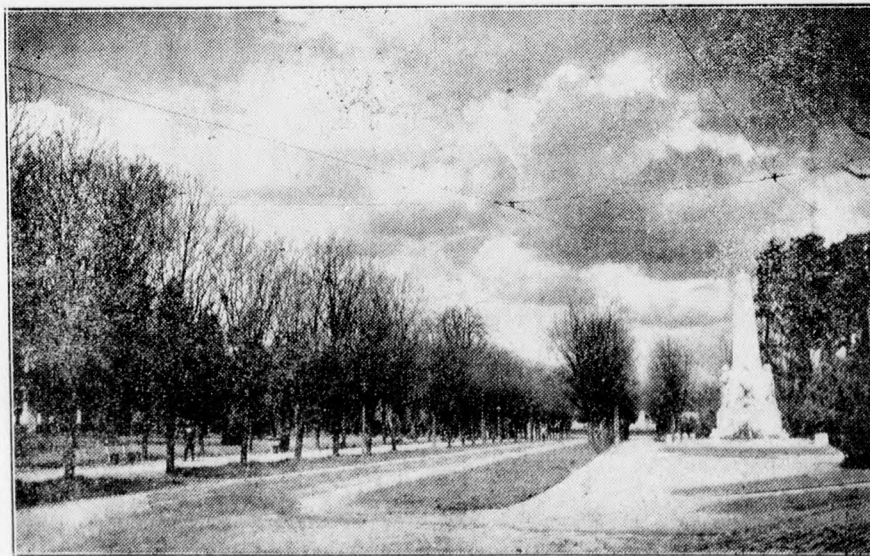
Tavas a Nagyerdőn.

Előfizetési határidő május 5. Megjelenés után a bolti ár 16 P