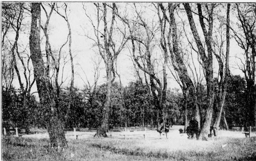
Tavaszi a Nagyerdőn.

Elég csak Szegedre és Pécsre gondolni, ahol az állam igen nagy beruházásokat hajtott végre ugyanakkor, amidőn Debrecennek jóformán semmi sem jut. A képviselőválasztás alkalmával kedvelt korteszólam volt, hogy a miniszterelnököt már csak azért is, mindentől eltekintve, meg kell választani Debrecen képviselőjévé, mert ettől lehet várni, hogy a kormány kedvezőbb hangulattal lesz az örök ellenzéki Debrecennel szemben és ennek a hangulatváltozásnak kézzelfogható eredménye mutatkozik majd az állami közmunkáknak Debrecenben nagy mértékben való megindulásában. Nos,