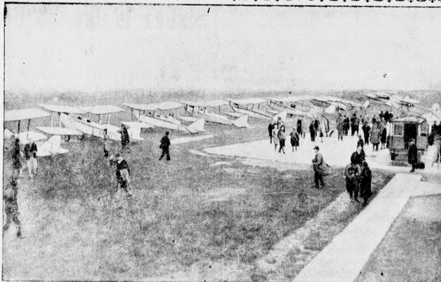
A Budapestre is ellátogató angol turista repülőgépei a start előtt Croydonban.

„En dicsőítelek Téged e földön: elvégezem a munkát, amelyet reám