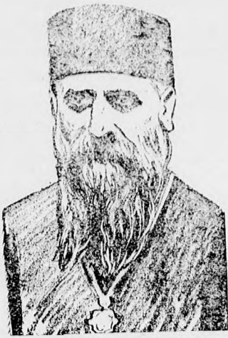
Szerbia új patriarchája: Barnava.