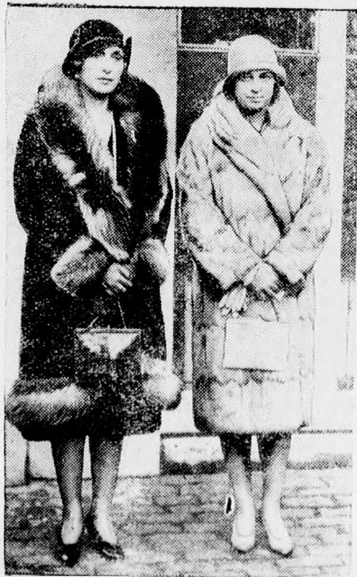
Beatrice spanyol hercegnő (jobbról), Alfonz király idősebb leánya, legközelebb minden valószínűség szerint eljegyzi magát Haimon spalato herceggel, az aostai herceg fiával.