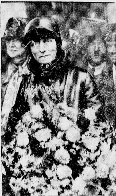
A 64 éves Bedford hercegnő London-Fokváros—London repülőútjának befejezése után a croydoni repülőtéren.