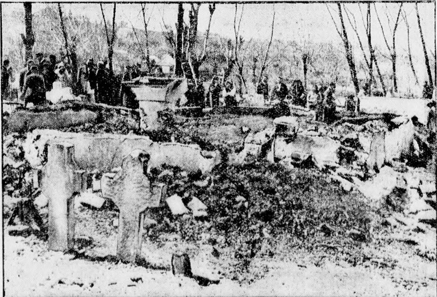
Cotesti templomának romjai, amelyek között száztiz ember lelte tüzhalálát.

mennél több vállalkozó munkához juttatása érdekében a munkálatokat