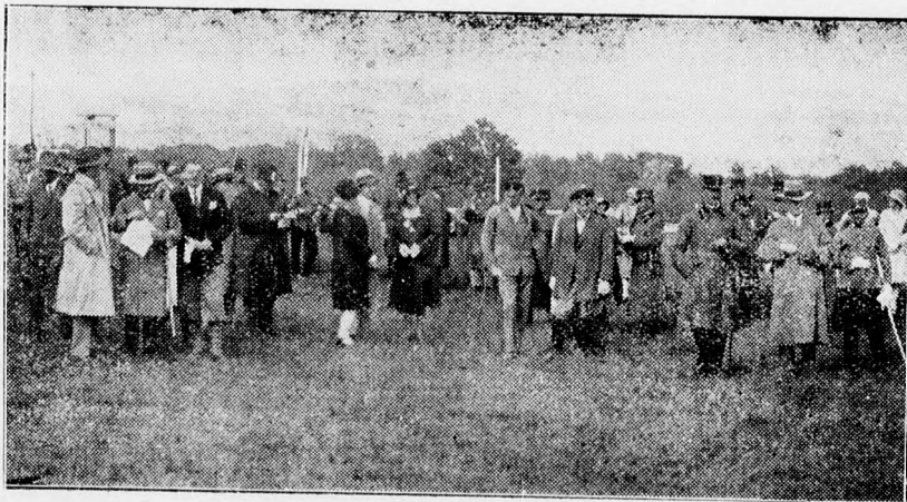
A debreceni löversenyek első napjának közönsége.

A csekély hátralék 5 millió pengő, szenedő hátralék 1.400.000 pengő, vagyoneként mutatkozik tehát 3.600.000 pengő. Ezt terheli a 667.000 pengő tulkiadás, tehát így csak 2.900.000 pengő marad. Ebben mindenféle követelés benne van, amelyeknek bizonyos százelekt még le kell írni, mint a haszonbér-érendedéseket és üzleti bérelendéseket, valamint le kell vonni a pót és rendkívüli hiteleket, amelyeket a közgyűlés engedélyezett, azt az 50.000 pengő tulkiadást, ami Debrecennek a második lakbérosztályba sorozása következtében áll elő, valamint a behajthatatlan követeléseket. A 2.900.000 pengő ilyenformán a minimumra redukálódik, a gazdálkodásban tehát a legnagyobb óvatosságra és fokozott takaré-