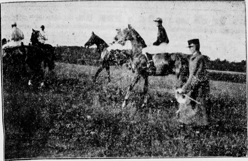
A debreceni lóversenyek első napja. — Start előtt.

Közvetíthetőség. A rádióvevő állomás és hangszóró-berendezés elkészítését a debreceni Pleyer-cég vállalta és a berendezést tegnap délután próbálták ki, amikor is kiderült az, hogy a közvetítés oly tökéletes, hogy a versenypályának a legtávolabbi zugában levő közönség is nagy hangerővel hallja a budapesti olasz-magyar mérkőzést konferáló hangját. Azonkívül a versenyek szünetjében a pályán gramofon közvetítéssel szórakoztatják a megjelent közönséget.