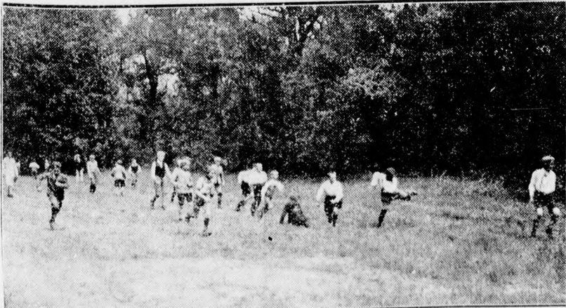
A debreceni reáliskola majálisa: Futóverseny a Nagyerdőn.

Működgyár. Németország—Anglia 3:3. Berlin, május 10. Németország—Anglia 3:3 (1:2). Nemzetközi futballmérkőzés, 50.000 néző. Vienna az osztrák kupagyőztes Bécs, május 10. Vienna—Rapid 1:0 (0:0). Osztrák kupadöntő. A gólt a második féldő 31. percében Gschweidl rúgta.