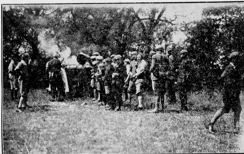
A debreceni reáliskola ma jálisa: Készül az ebéd.

A DEBRECENI FÜGGETLEN ÚJSÁG riportfelvételei megrendelhető Liener fotoszaküzletében, Piac ucca 34. szám. Hegedüs és Sándor-ház.