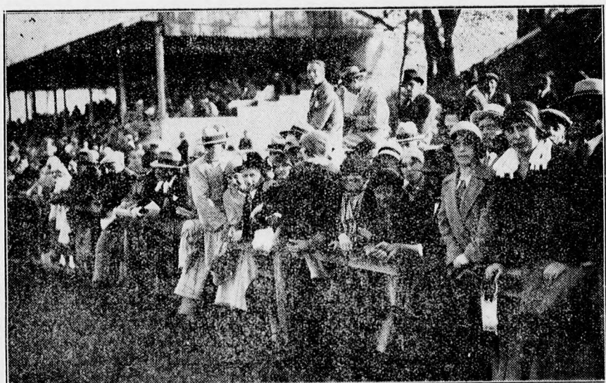
A debreceni löverseny közönségének egy része izgatottan figyel egyik verseny finisét.