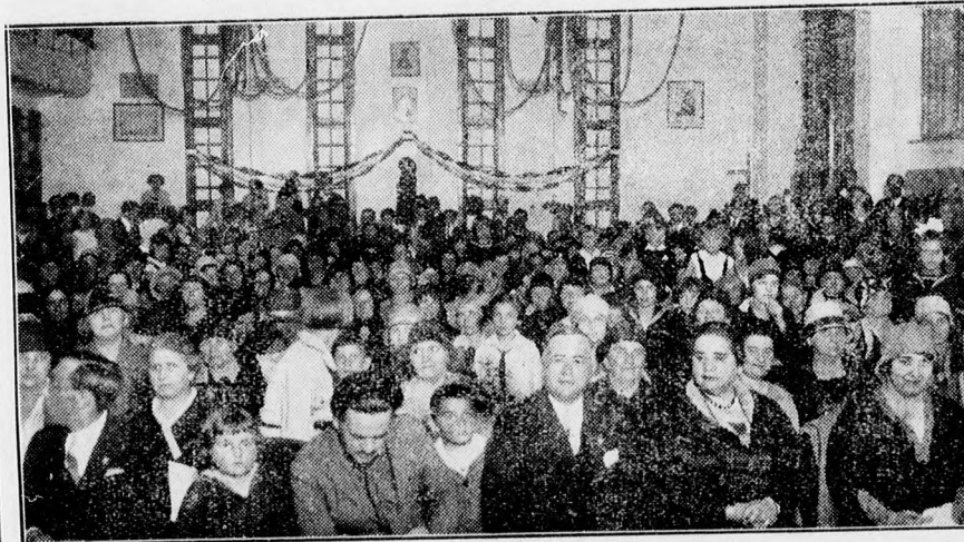
A hányverserkészek fogadalomtételi ünnepségének közönsége a Dóczy tornateremben.

Az ügyben rendkívüli közgyűlést tartottak, amely kis szótöbbséggel tudomásul vette a