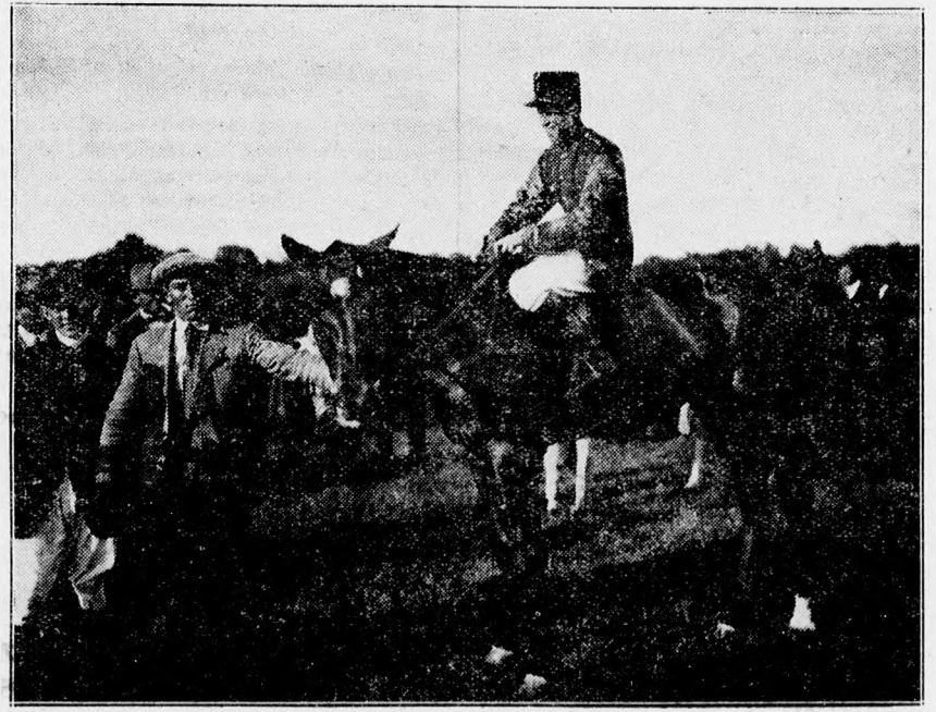
„Maga.” Az 1600 méteres sikverseny győztese. Lovagolta Valkó főhadnagy.

Gépirási és sokszorosítási munkák azonnal elkészülnek. Olcsó árak! REMINGTON IRÓGÉP R. T. PIAC UCCA 58. SZ. : Telefon 4-02