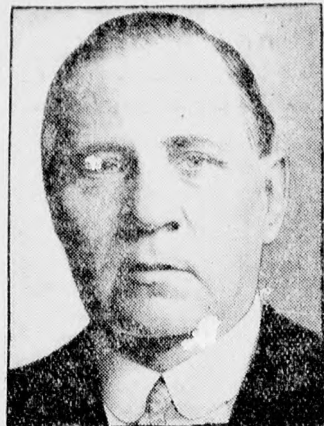
Edström (Svédország) a most összeülő berlini olimpiai kongresszus elnöke.