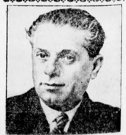
Max Reinhardt, a világhírű német ren- dező, akit a kieli egyetem után most a frankfurti egyetem is díszdoktorrá avatott.

A felsőház általánosságban, majd vita nélkül részleteiben is megszavazta a pá- risi egyezményt s ezzel az ülés délután félkettőkor befejeződött.