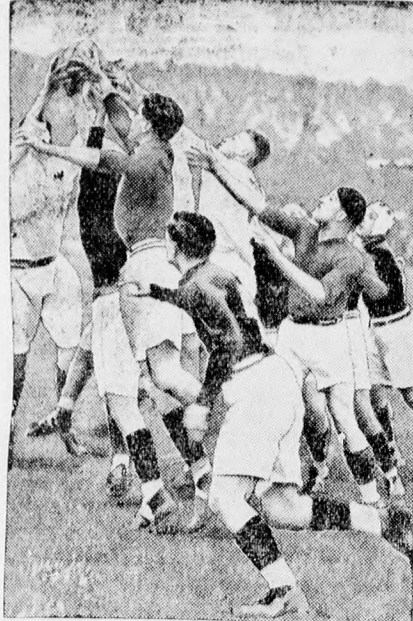
Rugby mérkőzés Newyork és Boston között.