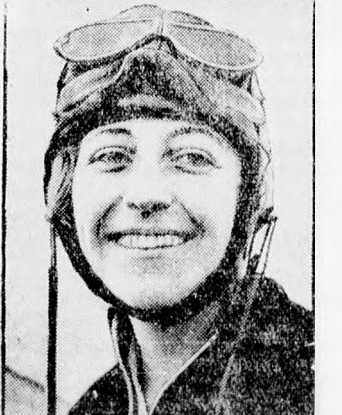
A női Lindbergh, a 22 éves Anny Johnson angol hölgypilóta, aki Londonból Ausztráliába indult, hogy ezzel új világrekordot állítson föl.

A BEMAC és a TTAC tátrai kirándulást tervez. Ezek szerint a start pünkösdi szombatján, június 7-én délelben lenne Miskolcra Krasznahorkára és a dobsinai jégbarlanghoz. Pünkösdi