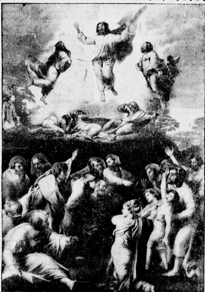
Rafael: Krisztus mennyebemenetele.

Versenyzőkben tehát nem lesz hiány és tekintetbe véve azt, hogy a startnál is számos jelentkezés történik, olyan versenyző gárdát láthat maga előtt a közönség, amellyel az ország egyetlen vidéki motorversenye sem dicsekedhetett eddig. A közönség soraiban is