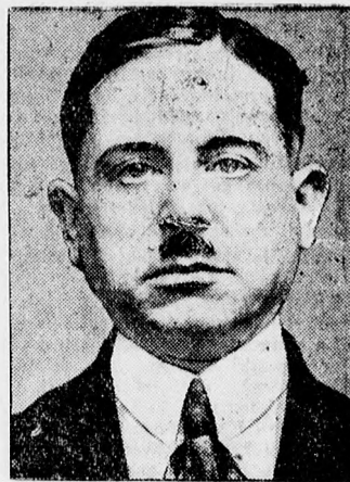
Peter Kürten, az elfogott düsseldorfi tömeggyilkos.

Valószínű, hogy Kürten ezuttal — vagy ezuttal is — hazudott.