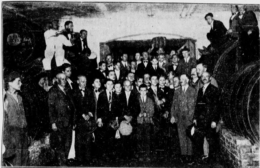
A pinceszakiskola tanulmányi kirándulása a Wolff-féle szőlőtelepen.