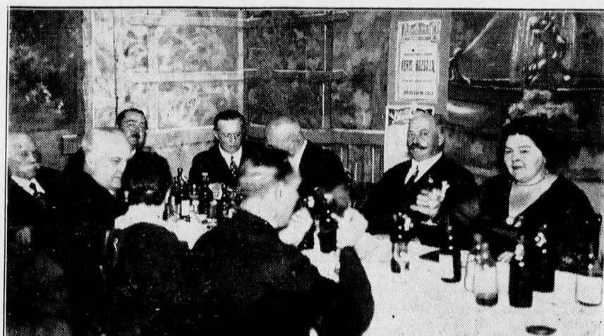
A hus- és sütőiparosok debreceni országos kongresszusának bankettje az Angol Királynőben.