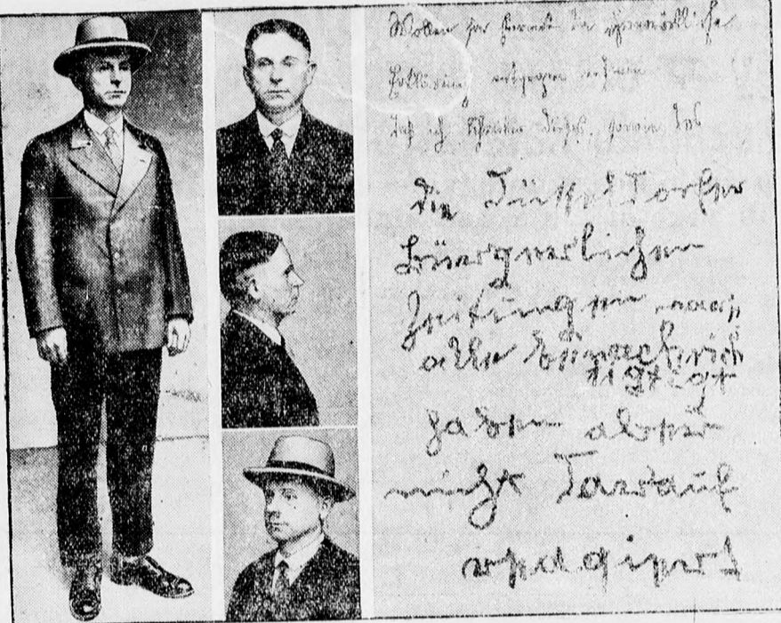
A düsseldorfi tömeggyilkos és egy „eredeti kézírata”. Balra: Peter Kürten négy rendőri fotográfiája. Jobbról: Peter Kürten két levele, amelyekben annakidején két gyilkosságot jelentett be a rendőrségnek.

Szemére húzott kalappal leste az exhumálás gyönyöreit.