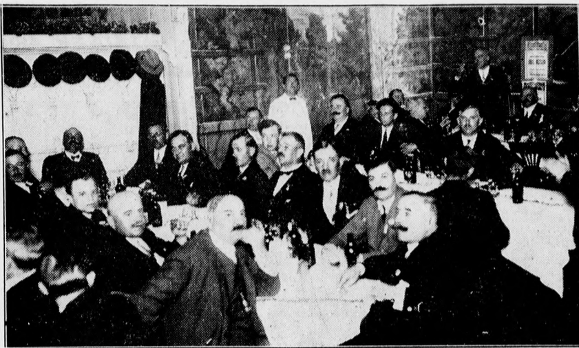
A hus- és sütőiparosok debreceni országos kongresszusának banketteje az Angol Királynőben.