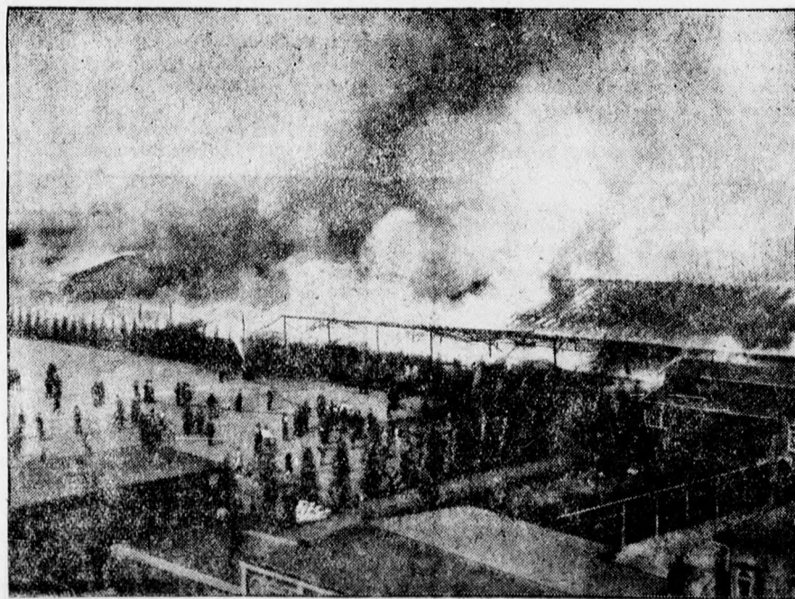
Óriási tüzvész pusztított mlnap Berlin keleti részében. Egy barakktelep gyulladt ki, de mire a tűzoltók kiérkeztek, a faházrengeteg porrá égett