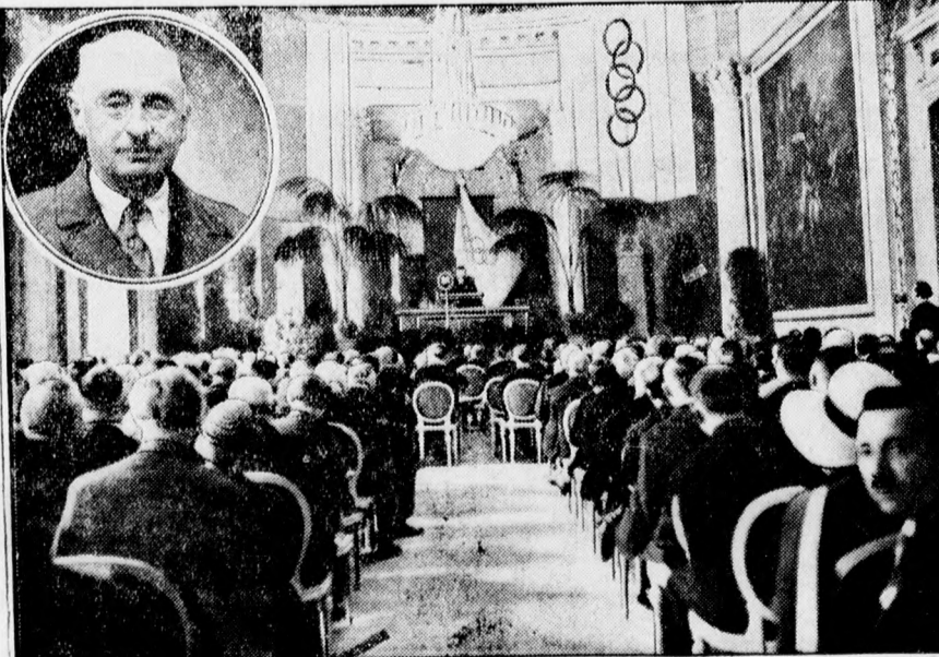
A berlini olimpiai kongresszus megnyitása az egyetem dísztermében. A körben: Ballet-Latour gróf, az olimpiai kongresszus elnöke.

— A lisztadó meggyőződés szerint nem fogja azt a célt szolgálni, amelynek érdekében a kormány életbeléptetni készült. Egészen bizonyos, hogy a bolettrendszer visszaélésekre fog alkalmat