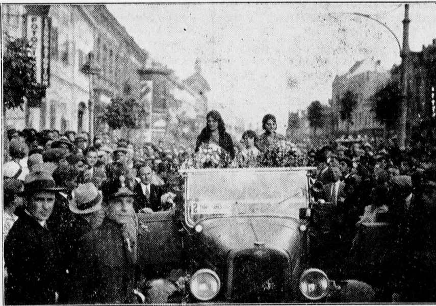
Miss Hungária és Miss Debrecen a tömeg ujjongása közben megérkeznek a Debreceni Független Ujság palotája elé.

Keletmagyarország százezer lakosu fővárosára, a magyar erőnek, a magyar kulturának és a magyar tehetségnek erre a hatalmas rezervoárjára, amely ime, nem-