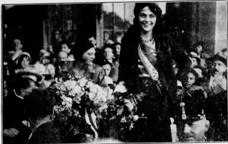
Miss Hungária mosolygva köszöni a tömeg ovációját.

nem lesz kint egy teremtet lélek sem a fogadásokra, — mondta az ut végén Miss Hungária.