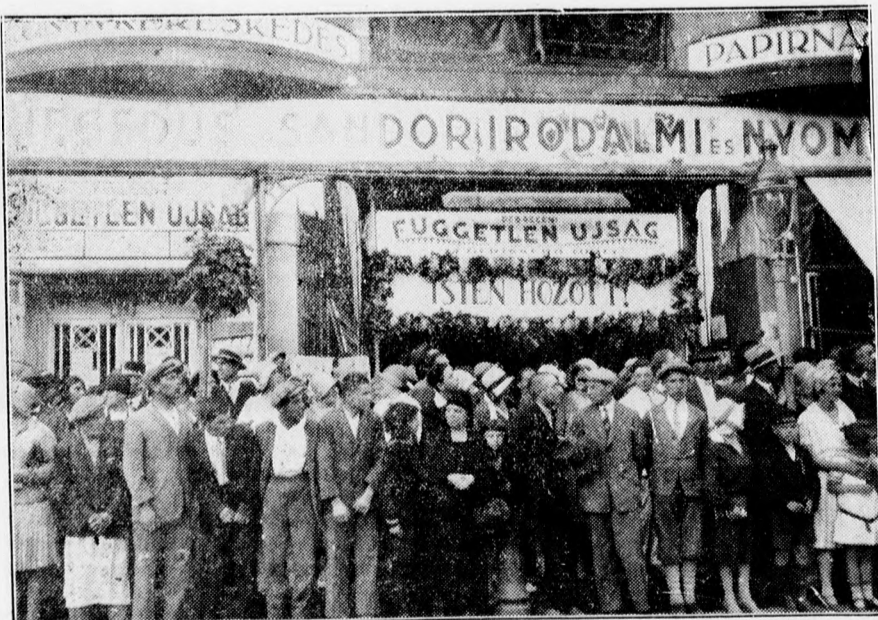
A tömeg egy csoportja várja Miss Hungáriát.

Ezen az utvonalon valamennyi ház ablakait is elfoglalták a kíváncsiak, az erkélyek is tömve voltak érdeklődőkkel és a Piac ucca harsá-