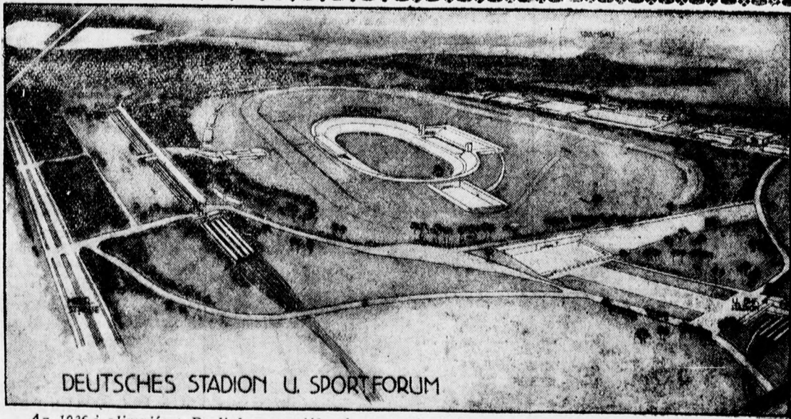
DEUTSCHES STADION U. SPORTFORUM

Az 1936-i olimpiászt Berlinben tartják. A nemzeti stadion építésére ezt a tervet fogadták el.