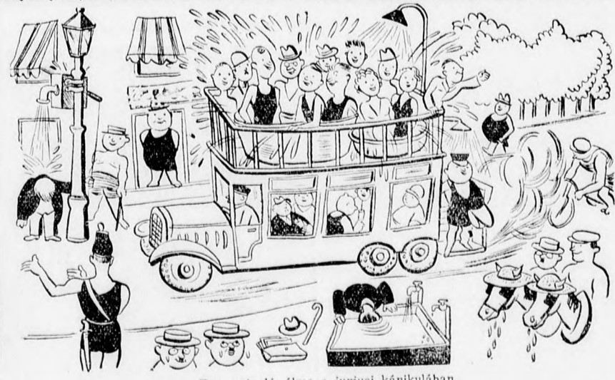
Egy rajzoló álma a júniusi kánikulában.

HAVAS harisnyaház Debrecen, Bádogos u. 1.