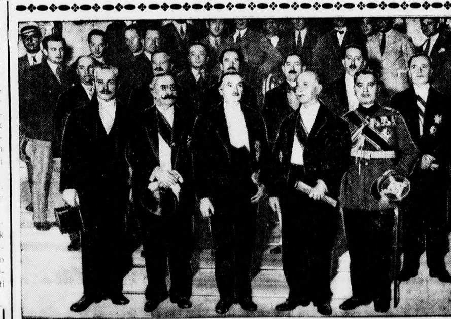
Az új román kormány. Az első sor balról jobbra: Costachescu kultuszminisz- ter, Vajda-Vojvoda belügyminiszter, Maniu miniszterelnök, Mironescu kül- ügyminiszter, Condescu hadügyminiszter. Második sor balról jobbra: Popo- vici pénzügyminiszter, Halipa munkaügyi miniszter, Michalache földműve- lésügyi miniszter, Madgearu kereskedelemügyi miniszter, Manilescu közle- kedésügyi miniszter.

— Az összes megjelenő szépirodalmi újdonságok, tudományos és ifjúsági köny- vek a megjelenés után azonnal kaphatók a Debreceni Függelven Újság Kölcshö- könyvtárában.