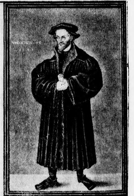
Az augsburgi hitvallás négyszázadik évfordulója. Balról: Luther Márton. (Az augsburgi hitvallás 1730-i évfordulóján kiadott arcképe.) Középen: Kilátó az augsburgi városházára. Jobbról: Melanchton Fülöp, az augsburgi hitvallás szerzője. — Junius 22-én kezdődtek Augsburgban az augsburgi hitvallás 400 éves évfordulójának ünnepségei. — 1530-ban nyújtotta át Melanchton a császárnak az augsburgi birodalmi gyűlésen az augsburgi hitvallást.