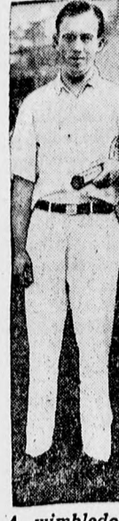
A wimbledoni cíjja: Coche vereséget