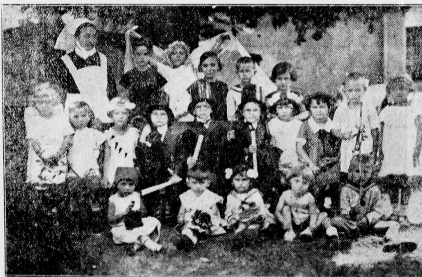
A diakonissza nővérek vezetése alatt álló klinikai telepi óvoda apróságai kedves záróünnepélyének résztvevői a vezető diakonissza nővérral.

— Ami a lelkiismeretem világát illeti — amely világ tiszta és erős —, nekem erre abizalomnyilvánításra szükségem