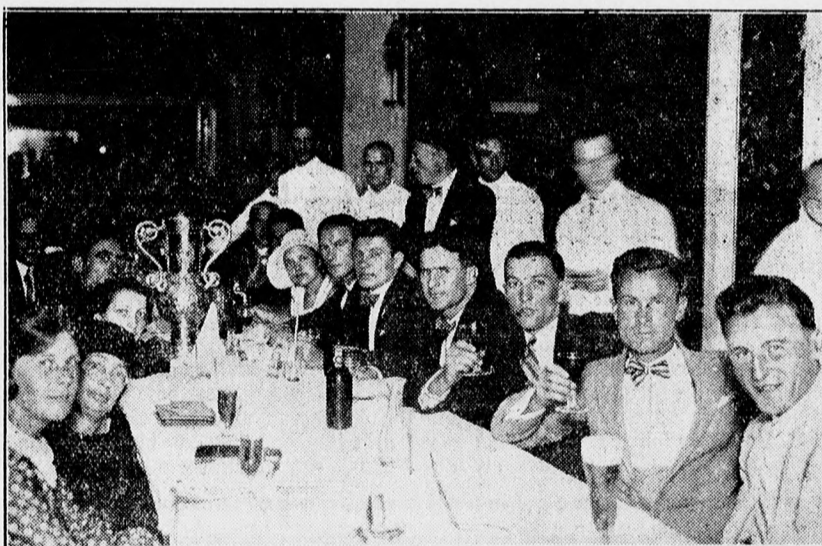
A Bocskay kupaavató bankettje az Arany Bikában. A játékosok a magyar kupával.