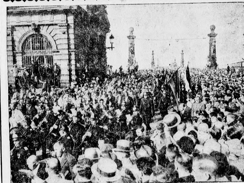
A Rajnavidék kiirtése. A német katonák ünnepélyes fogadtatása a Mainz és Kastell közt levő hidon.

A váditanács, mint Halassy esetében, ezuttal is pontonként foglalkozik a különböző vallomásokkal és ezekből azt a következtetést vonja le, hogy alapos gyanuokok forognak fenn a megvesztegetés büntetetté Vay Kázmér ellen. A váditanács megállapítja, hogy a megvesztegetés gyanúja fenforog. Littke be-