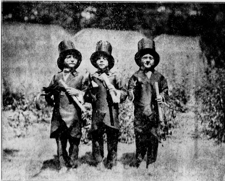
A klinikai telepi óvoda záróünnepélyén ek három kedves gyermekrésztvevője.

Gyászjelentéseket, közösmentnyilvánításokat gondos kivételben, olcsó árban készit a Hegedűs és Sándor rt. nyomdáj. Piac ucca 40., II. udvar.