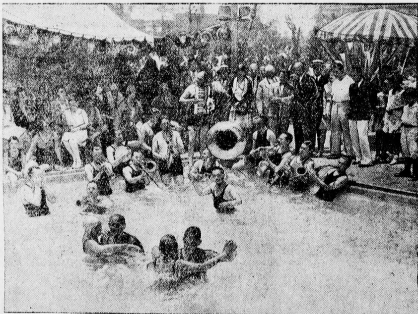
Fürdőélet Floridában. A fürdőzők jazz zenekart vittek a vízbe és ennek zenéje mellett táncolnak a vízben.

A LEGOLCSÓBB ÉS LEGJOBB SZÓ- RAKOZÁS A JÓ KÖNYV. IRATKOZZON BE TEHAT MÉG MA A DEBRECENI FÜGGETLEN UJSÁG KÖLCSÖNKÖNYVTÁRÁBA.