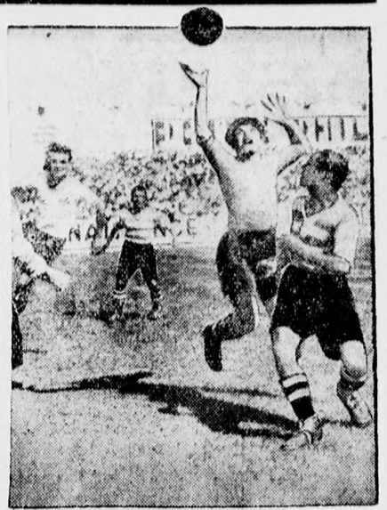
Jelenet Genfben tartott európai futball-tornáról. — A francia kupagyőztes Sete küzdelmé a német bajnok Fürth ellen, amely végre több meghosszabbítás után megnyerte a meccset.

A Bécs—Berlin—Budapest városközi 8 evezős versenyt ma délután bonyolították le. — Első lett Berlin csapata, amely 6 perc 41.8 mp. alatt tette meg a távot. Második a Hungaria Evezős Egylet 6.46.8 másodperc idővel.