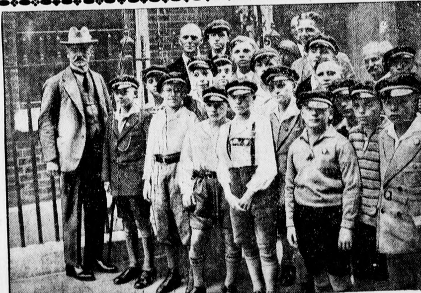
Német iskolágyermekek Londonban MacDonal angol miniszterelnöknél.

Fitz Artur előadó ismertette ezután a Társadalombiztosító betegségi ágazatának szanalásáról szóló javaslatot.