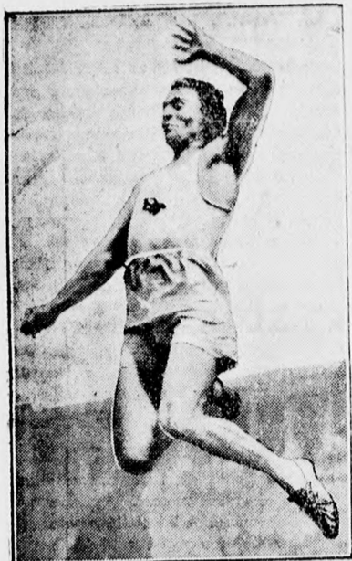
Hamm, az amerikai könnyű atlétikai expedíció starja, az Egyesült Államok legjobb távolugrója. Jelenleg Európában versenyez.

aminek minden megnyugtató kijelentés dacára is a lisztnek és a kenyérnek a megdrágulása lesz a következménye, ez nem az a gazdasági program, amelyet az ország várt és remélt s ami a gazdasági helyzetet orvosolhatná.