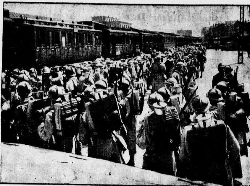
A Rajnavidék kiűritése. Az utolsó francia csapatokat bevagonirozzák a mainzi pályaudvaron.

állami és városi alkalmazottak új házat vehetnek 25 éves adómentességgel, 350 négyzetméterrel a Kassai ut és a mélyfúrás között. Hátralekötő lakbörrel értekezni tulajdonosnál, Vár ucca tiz szám.