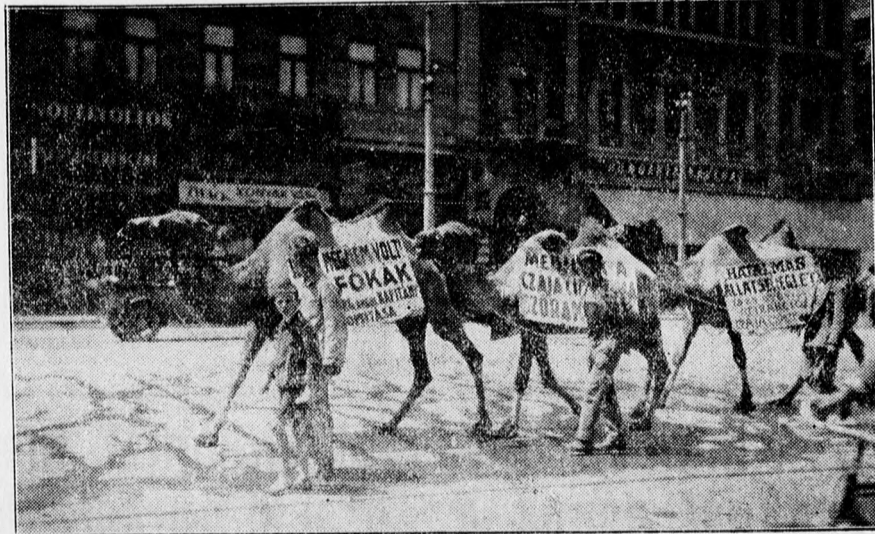
A Czája-cirkusz kétpupu tevéi nagy érdeklődést keltenek a déli korszón.

A jelentést tudomásul vették és ezzel az ülés véget ért.