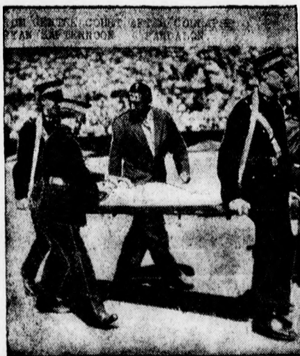
Cilly Aussem tennisz bajnoknő a wimbledoni versenytérrel szembeállították ki lábificamódása után.