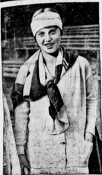
Cilli Aussem, a kiváló német teniszversenyző, aki a wimbledoni versenyen a legjobb eséllyel indult s favoritja volt a versenynek, azonban vissza kellett lépnie, mert a Helen Wills-szel, a bajnoknővel folytatott küzdelme közben kifáradott a lába.

... kasza alapján tisztelettel bejelentem, hogy mint segéd nélkül dolgozó (tanoncám száma...) kézművesiparos 1930. júl. hó 1-től kezdve a forgalmi adómentességre igényt tartok.