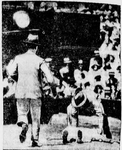
Cilly Aussem, a német teniszbajnok, a wimbledoni teniszversenyek favoritja, láb-ficamodást szenvedett játék közben és összeesett.