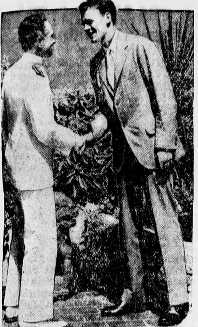
Byrd és Lindbergh, a két világhírű repülő találkozásánál.

golták az evőeszközöket a hátizsákba és megszólalt Kelemen: — Most pedig gyereink szépen haza! A fiu megrázta a fejét. — Tudod mit, papa — mondta — olyan szép itt, hogy inkább itt töltöm az egész napot és csak holnap megyek haza. Így is történt.