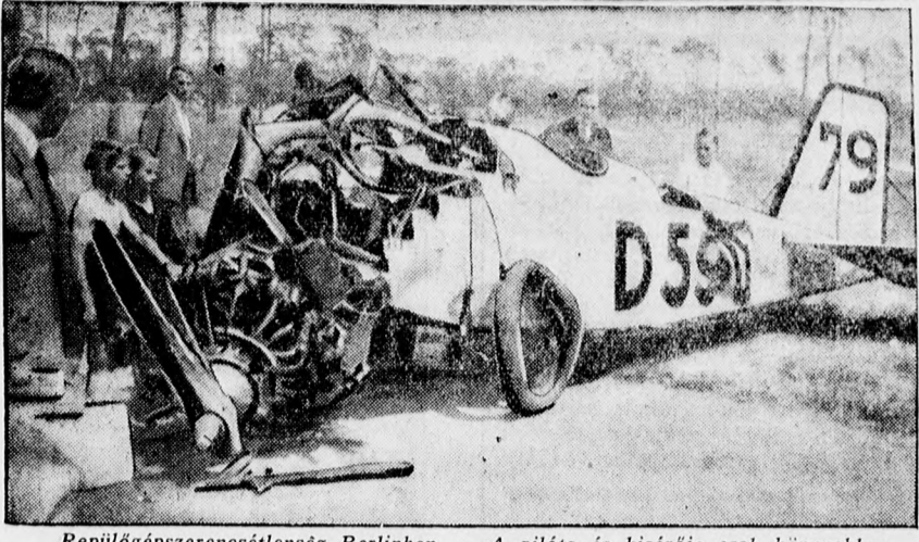
Repülőgépszerencsétlenség Berlinben. — A pilóta és kísérője csak könnyebben sebesültek meg.

A LEGOLCSÓBB ÉS LEGJOBB SZÓ- RAKOZÁS A JÓ KÖNYV. IRATKOZZON BE TEHÁT MEG MA A DEBRECENI FÜGGETLEN ÚJSÁG KÖLCSÖNKÖNYVTÁRÁBA.