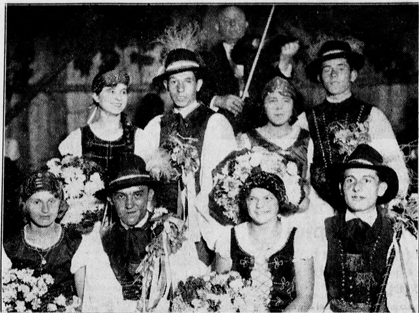
Az Ujvárosi uti Olvasókör cseresznye szüreti mulatságának résztvevői. A csöszpárok