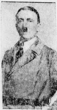
Hitler Adolf, a horogkeresztesek híres vezére, a nemzeti szocialista munkáspárt vezetője, aki egyik megalapítója az új forradalmi nemzeti munkáspártnak.