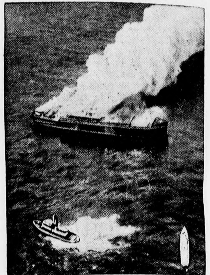
Az amerikai prohibíciós rendőrség felgyujtott egy szeszcsempész hajót a nyílt tengeren.

Párisi izlés Eredeti modellek KLEIN LEONA divatszalonjában Csapó ucca 10. szám I. emelet.