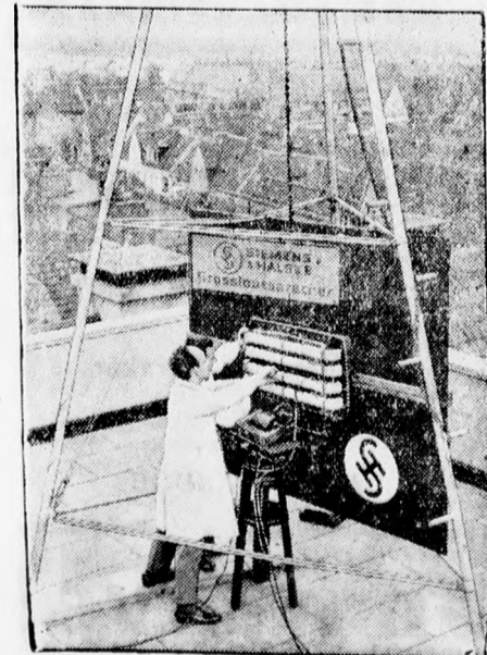
Óriási hangszóró. Berlinben állították föl ezt a hangszórót, amely 2000 emberből álló orchester játékaiként hangzik. — A hangot 20 kilométerre is közvetíti.