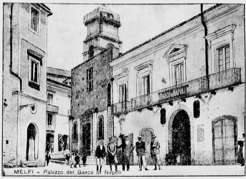
Melfi olasz város a földrengés előtt. Ezek az épületek is rombadőltek.