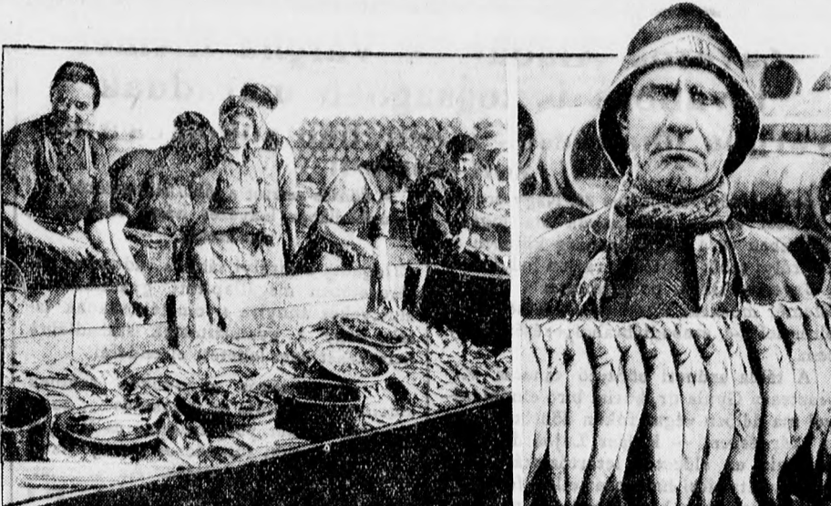
Megkezdődött a heringfogás. Egyedül Cuxha venben az utóbbi napokban 3 millió font hering kelt el az aukciókon.