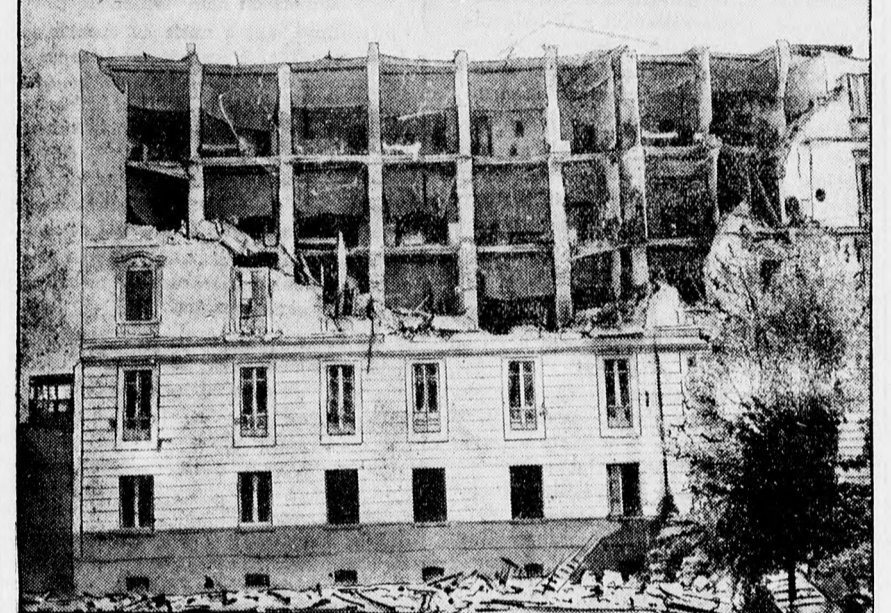
Az olaszországi földrengés. Egy lakóház Nápolyban a Via Casanován a földrengés után

Legalább 10.000 lesz a halottak száma, de könnyen lehetséges, hogy több mint 20.000.