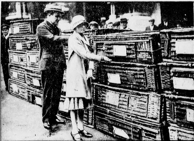
Londonban versenyt rendeztek az expressz vonat és a postagalambok közt, amelyben az expressz vonat győzött. A galambok fonott kosárkettegekben várják a startot.

hogy van-e terv és költségvetés a dohánypajtára.