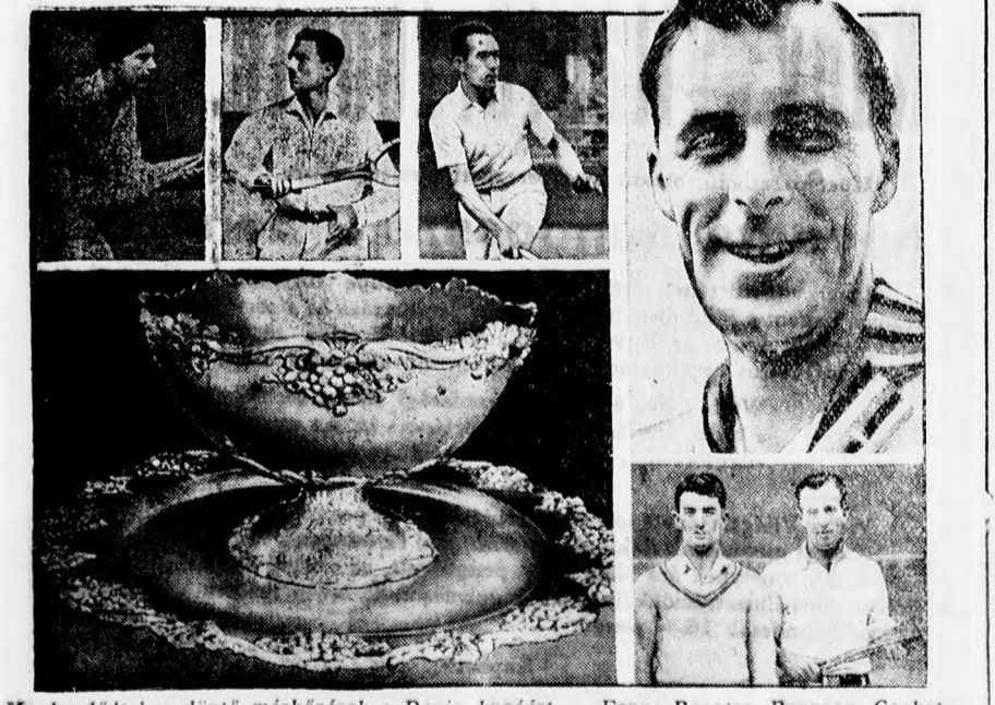
Megkezdődtek a döntő mérkőzések a Davis kupáért. — Fenn: Borotra, Brugnon, Cochet. Jobbra: Tilden. Lenn balra: A Davis kupa. Jobbra: A favorit amerikai pár: Bay Rym és Allison.