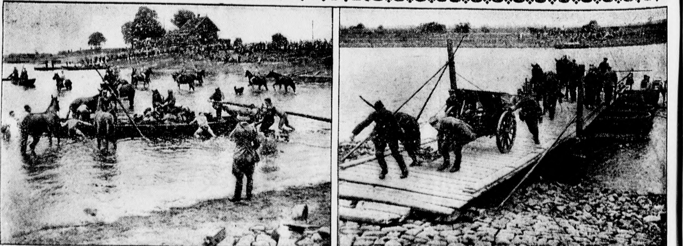
A németek ismét nagy hadgyakorlatokat tartanak. Lovasok, tüzekek gyakorlatai folyón.