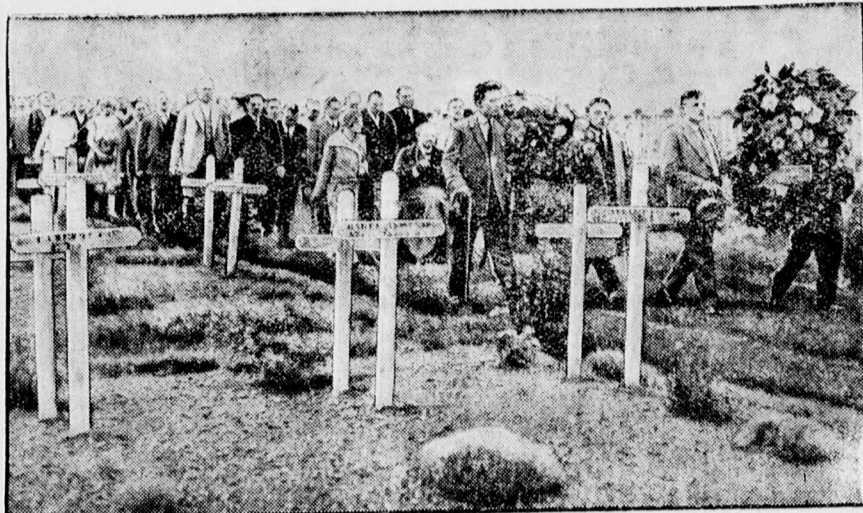
A német frontarcos katonák meglátogatják elesett német bajtársaik sírját Soissonban.

— Az összes megjelenő szépirodalmi újdonságok, tudományos és ifjúsági könyvek a megjelenés után azonnal kaphatók a Debreceni Független Újság Kölesbőnkönyvtárában.