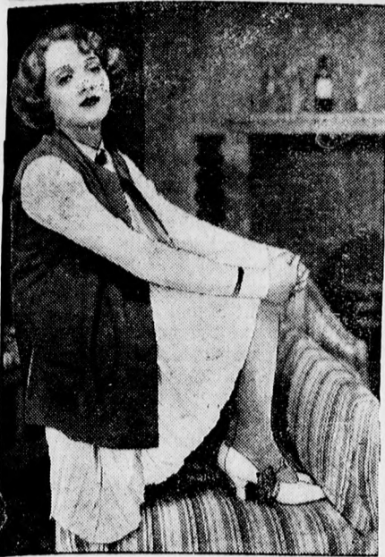
Marlene Dietrich, a „Kék angyal” című hangos film főszereplője, akinek az amerikai női szövetségek fellépése miatt abba kellett hagynia amerikai filmszereplését, mert bojkottálták. A bojkott oka az volt, hogy a film rendezője miatta elvált a feleségétől.

Ujéagot vásárló és 174 száma szelvény TÁRAT