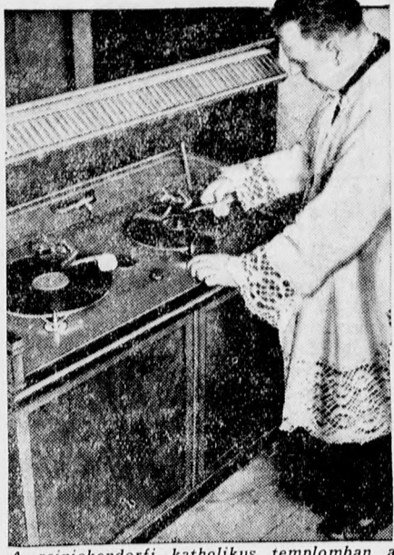
A reinickendorfi katolikus templomban a templomi zenét gramofon szolgáltatja, amely tizenkét lemezt megszakítás nélkül játszik le.

Newyork, augusztus 5. Az amerikai hőségnek már több halálos áldozata van. Newyorkban tegnap