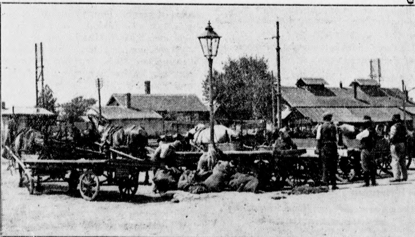
Fuvarosok déli pihenőn a kisállomás előtt. Nincs fuvar.

Ez a hódolatlak ma sok magyar szemében gyanús. Pedig a jövő meg fogja mutatni, mennyire Advé volt az igazság, mikor újból meg újból fölemelte tiltakozó szavát hebehurgva nemzetiségi politikánk ellen. Ez a politika nagy