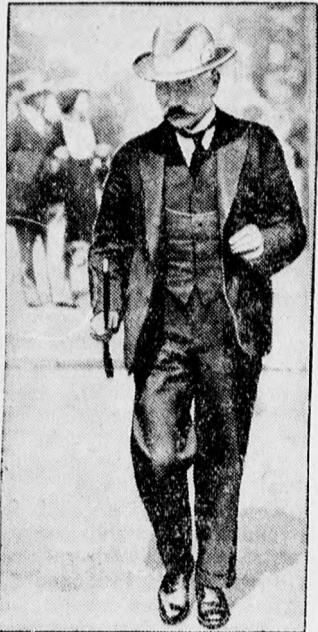
MacDonald Oberamergauban a passiójátékok megtekintésére indul.