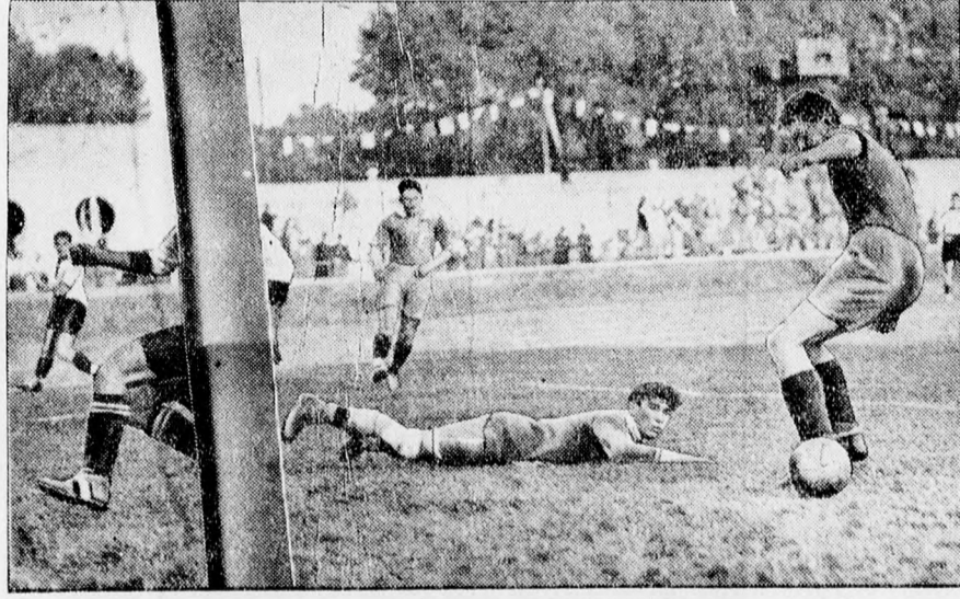
A darmstadti főiskolai versenyek. Németország győz Luxemburg ellen a futballban. (8:0.)

Az új hóhullám vont a maga után a hét-fői gabonatorzsédeken azt a viharos áremelkedést is, amely az egyes gabonafajták árát métertermézsánsként átlag egy pengővel hajította fel.