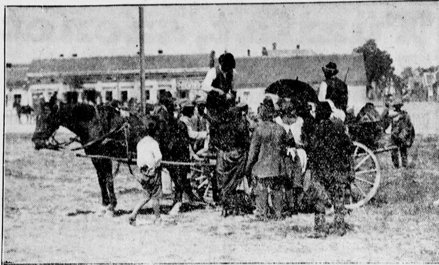
Megindul a vásár az új dinnyepiacon.

Hívások másolatokkal együtt d. e. 11-5-ig és d. u. 6-tól másnap d. e. 11-re elkészülnek.