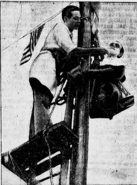
Európai örületek. A borbély megorotvált egy „Levegőkörder”-t, aki már napok óta egy zászlóárbocon tartózkodik.

hajón utaznak Rio de Janeiroba. A szépségkirálynők elutazásakor a kikötő megtelt érdeklődőkkel és a Misseket megostromolták a fényképezésk és a filmoperatőrök. A hajón nagy luxussal berendezett elsőosztályú kabinokban helyezték el a szépségkirálynőket. — Miss Magyarország, aki a legfiatalabb az európai szépségkirálynők között, Miss Németországgal és Miss Ausztriával barátkozott össze a legjobban. Miss Spanyolország legjobb barátnője Miss Sziria, talán azért, mert mindkettőjüknek koromfekete hajuk és szemük van és testbőrük barna. Miss Törökország Miss Oroszországot szereti a legjobban; Miss Franciaországnak pedig legkedvesebb barátnője Miss Anglia. A szépségkirálynő