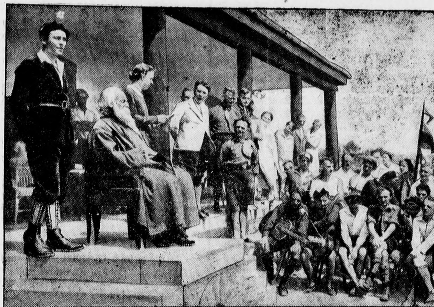
Rabindranath Tagore a rajnai egyetemi ifjuság között.