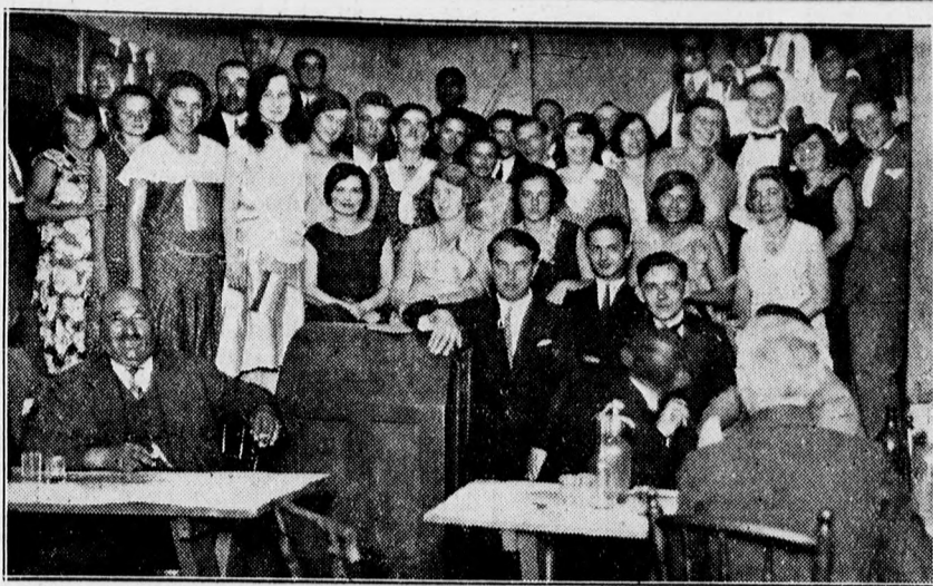
Az esperantisták debreceni csoportja ism. rkedő estjének szereplői és résztvevői.

Az én apám nagyon diszkrét ember. Képzeld csak: egyszer észrevett egy nővel és nem szólt egy szót sem. Az én apám sokkal diszkrétebb ember. Az én apám olyan diszkrét, hogy még ma se tudom, hogy hívják.