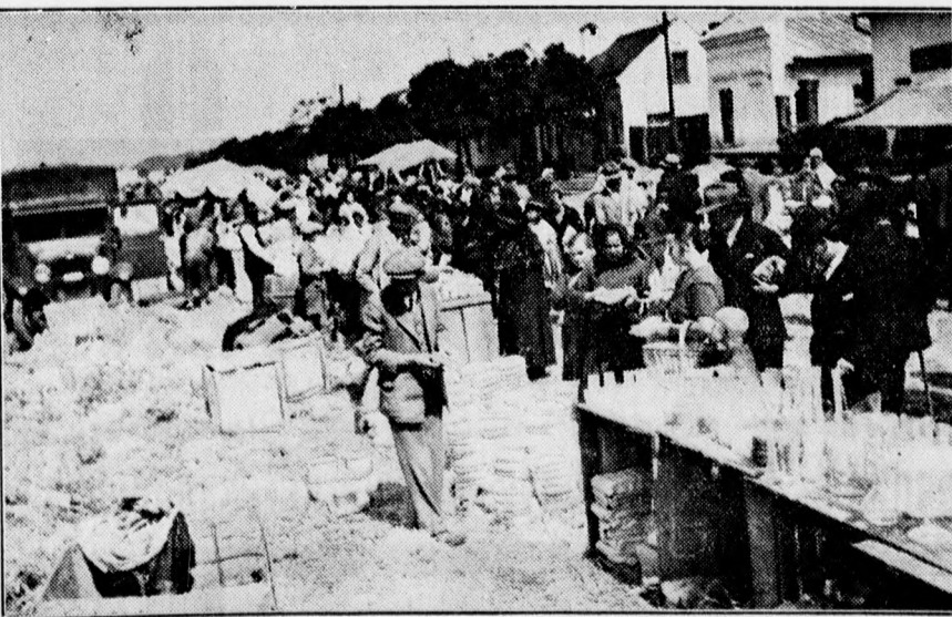
Az edényárusok. A debreceni Lőrinc napi vásárból.