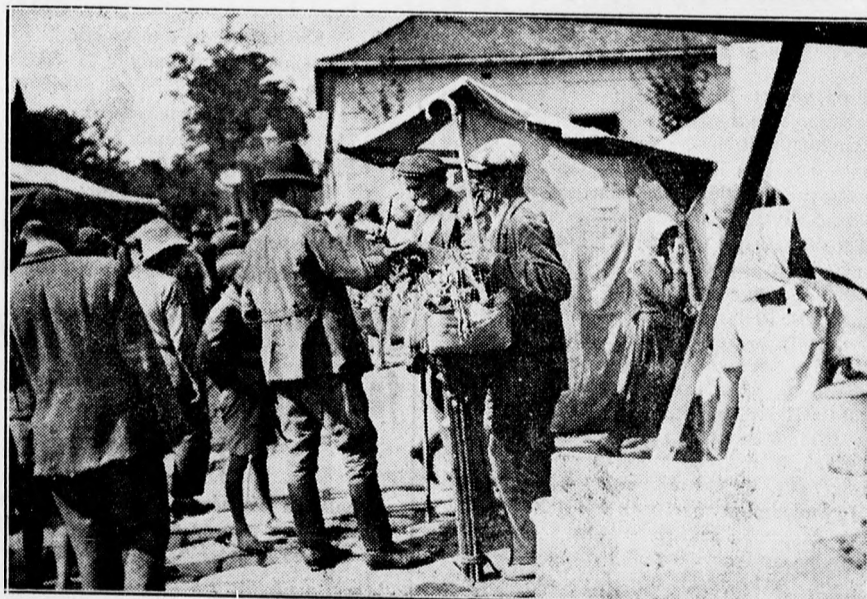
A debreceni Lőrinc napi vásárból. A bosnyák árusok és a lacikonyha sátrak.

Illetékesség szempontjából tehát az a békebiróság illetékes eljárni,