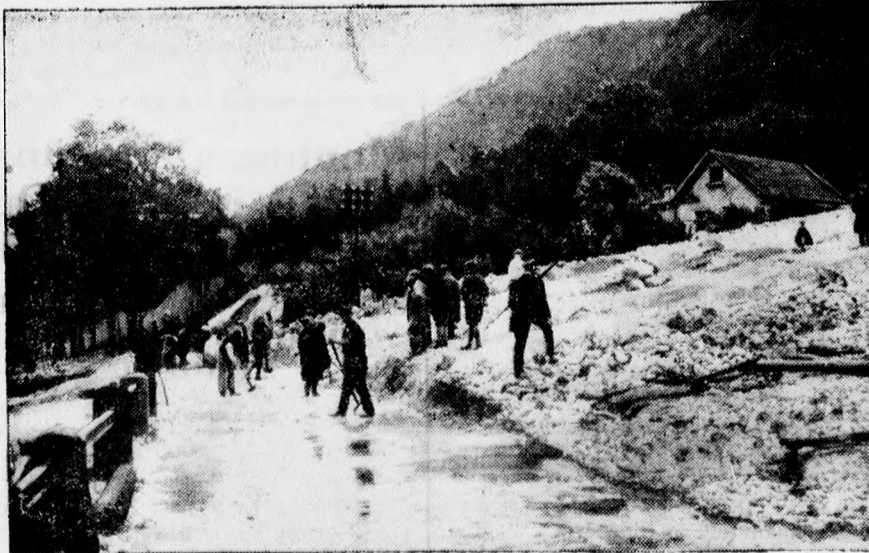
Orkán Reichenhall fürdőben. Az orkán elpusztította az utakat, erdőket irtott ki, házakat rombolt. Egész hegyoldalakat beborított a rom, törmelék. — Képünkön a munkások az utakat tisztogatják és teszik szabaddá.

Bizős anyagokat csak éjjel 10 órától reggel 5 óráig lehet fuvarozni. A Piac utcán keresztül azonban ilyen anyagok egyáltalában nem szállíthatók.