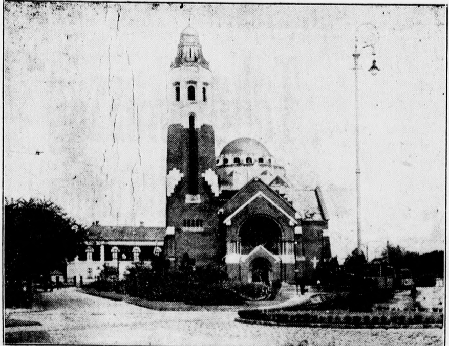
Szép park veszi körül most már a görög templomot is.

Szinte kényelmetlen most már Ponsonbynak arról beszélni, hogy milyen propaganda eszközöket használtak a szövetségesek, hogy igazolják az általuk vezetett háboru. Minden háborus fél a ráerőszakolt háboruról beszélt és azt hangoztatta, hogy az ellenfél egoista és brutális módon akarja elnyomni a népeket. Ponsonby nagyjóúveg alá veszi ezeket az állításokat, valamint a háborus célokat, amelyeket az országok hivatalosan hirdettek. Angliá-