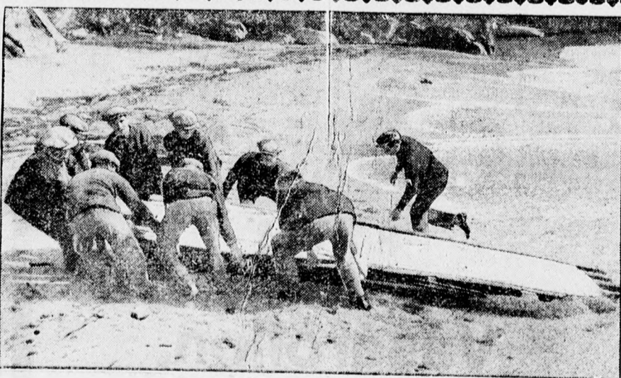
A corwalli tengeri katasztrófa, amelynél elpusztult King volt miniszter yachtja s azon a tulajdonos és kilenc más utas a tengerbe veszett. A halászhok már csak a luxushajó romjait tudták a partra huzni.

és a földre teperve ütlegelte. A véres eset részletei a következők: