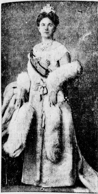
Wilma, Hollandia királynője, aki most lett 50 éves, 32 éve uralkodik.