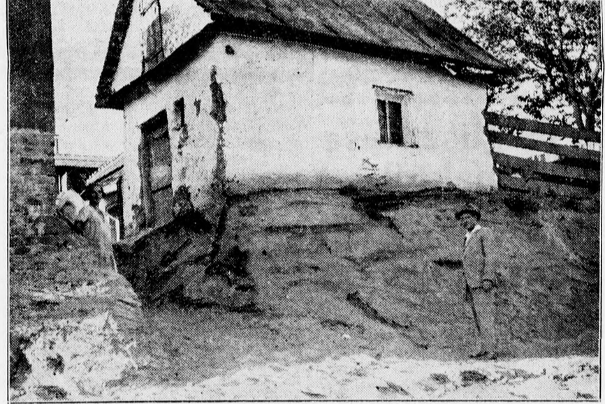
Egy sarokház, amelyet teljesen körüláztatott a műszaki hivatal s amelyet az első nagy eső levihet az uccára.

egyszerre magasan a levegőbe kerülnek, némelyikhez két és fél méter magasságból kell telmászni. Az, hogy min mészik fel az ember, rendszeren a kis házacskó tulajdonosának anvagi helyzetétől függ és ugyancsak ettől függ, hogy megmarad-e épségben a házacskó, vagy pedig az egyik fala lecsuszik az uccára, amely három méternyi szakadékokban tártog az alapozása alatt. Az egész Csapókertet szegény emberek lakják. A szegény emberek építette házaknak persze nem valami erős az alapja és hogyha az uccára eső fal mellett levágják a jó debreceni homokot, három méternyi mélyen, azonnal peregni kezdenek a homokszemecskék le az uccára. Eső jön, szél jön, egyre pergeti, egyre vájja a ház alapját képező homokot és lassanként az embermagasságra felkerült alapozás már csak a levegőben lebeg mindaddig, amíg egyszer csak a nehézkedés törvényei sze-