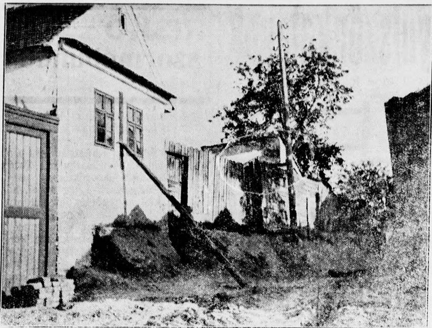
A város műszaki ügyosztálya a Csapókerthben kiásatta az uccákat s most a házak, amelyek alapja alól kiomlik a föld, bedőléssel fenyegetnek. Ez a kép a Mikos Kelemen uccáról készült, ahol „csak” egy méter 80 centiméteres bemélyítések történtek.