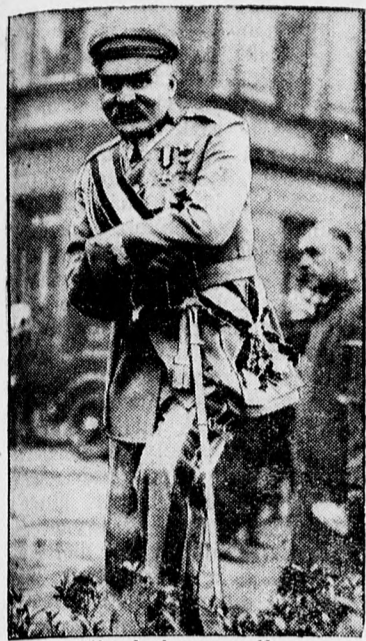
Pilsudsky marsall, Lengyelország volt diktátora és elnöke...