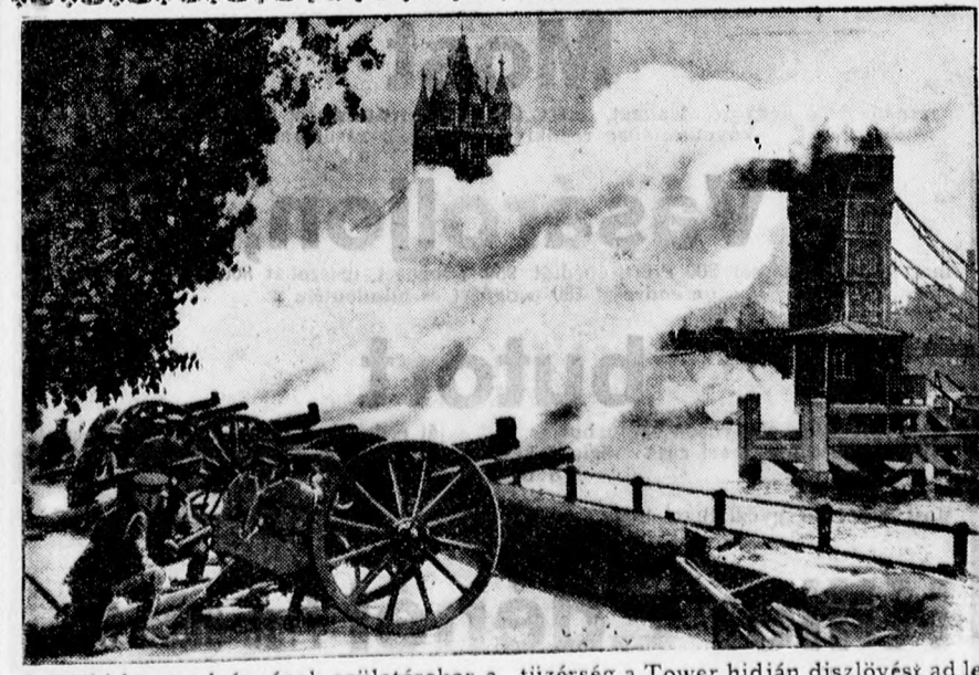
A yorki herceg leányának születésekor a tüzérség a Tower hidján diszlóvést ad le

Hívatásait... tülkőrfényes másolatokkal leggondosabban és leggyorsabban Szakál Géza fotoszaküzlet modern laboratoriuma, Piac u. 34., készíti el.