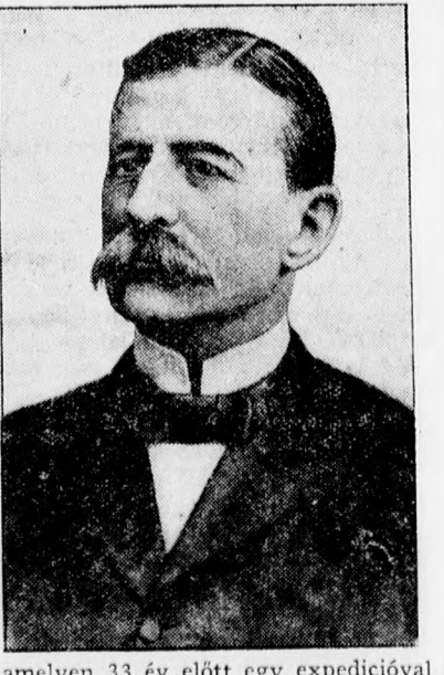
André Gusztáv svéd mérnök és léghajója, amelyen 33 év előtt egy expedícióval az északi sarkra repült. Utközben baleset érte a léghajót, amely az expedíció tagjaival együtt elpusztult 1897-ben. A pusztulás helyét most fedezték fel és ott megtalálták jégbefagyva André holttestét is.