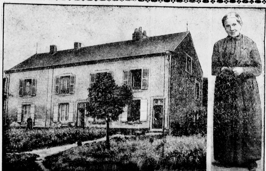
Sedan 60-ik évfordulója.