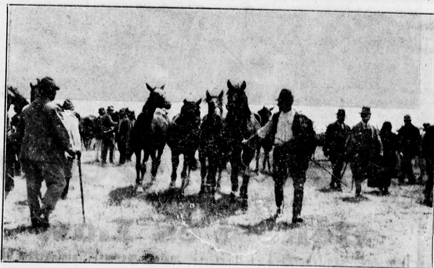
Eladásra kerülő lovak a szeptember 18-i hortobágyi hidvásáron.

LEGJOBB HIRDETÉSI ORGANUM A DEBRECENI FÜGGETLEN UJSÁG.