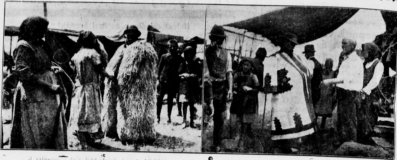
A szűrszűrés és a juhászbundás ruhák kivételével a szeptember 18-i hortobágyi hidvásáron.