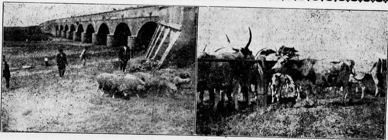
A híres kilenclyuku hortobágyi köhid. Szarvasmarhák a szeptemberi hortobágyi vásáron.

Magyar Amatőrök Országos Szövetsége fényképpályázatára nov. 1-ig bárki jelentkezhet. Jó képekkel értékes díjakat nyerhet!