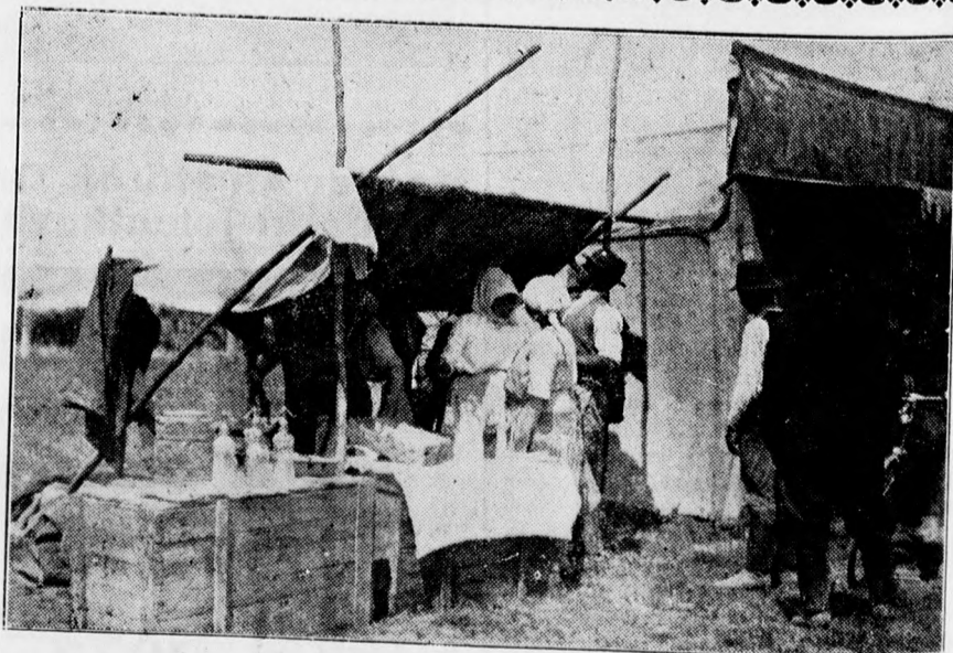
Lacikonyhások a szeptemberi hortobágyi hidvásáron.