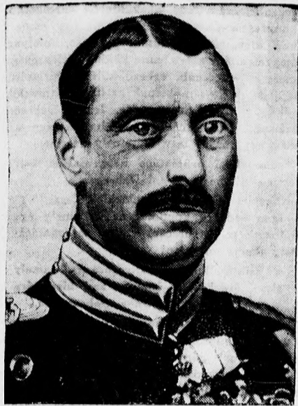
X. Keresztély dán király 60 éves.

Hrabéczy gyár vasalóosztálya elvállalja férfiföltő-nyők, női, férfi felöltők vasalását amerikai vasalógépen, fertőtlenítéssel. Olcsó, kifogástalan munka