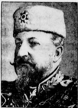
Ferdinánd, a volt bolgár cár, aki 12 év előtt történt lemondása után most visszatér Bulgáriába.

Szeptember 26-án. Pétervására. Marha és sertésvásár: Békés. Kirakodóvásár: Kecskemét.