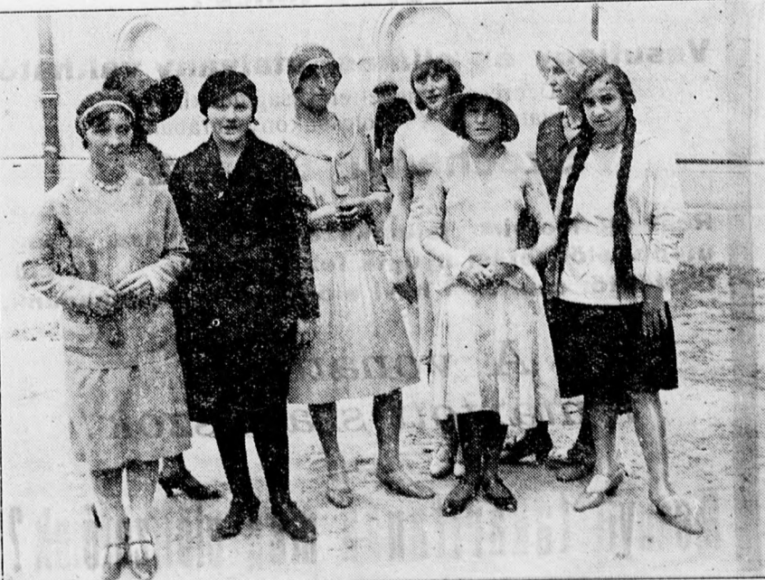
A görlsorozásra jelentkezettek egy csoportja a Csokonai-színház színpadi bejáratánál.

Hétfőn este mutatta be új műsorát a Vígézház Mozgó. Bemutatásra került a Vadölő című vadnyugati história, amelyet jobb lett volna a vadnyugaton bemutatni. Régimódi rendezés jellemzi a Vadölőt, amely sem meséjével, sem pedig az ilyen vadnyugati históriákat élénkítő bravurokkal nem nagyon diesselkedhetik. A műsor második részét a Botrány című film-dráma töltötte ki. A kilenc felvonásos dráma főszerepét Laura la Plante játszotta kedvesen. Ez a film jó közepes. Lovaspólo mérkőzések, gyönyörű tengerparti felvételek értéket is adnak neki. A meséje is izgalmas, de már több darabban találkoztunk hozzá hasonló témájával.