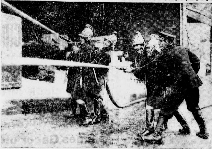
Női tűzoltók Angliában.

A fiatal munkás zsebében találtak egy bucsulövetet, amelyben bejelent, hogy önként