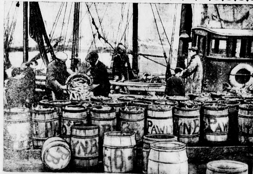
Az Északi tengeren megkezdődött a heringfogás. A heringeket csomagolják.