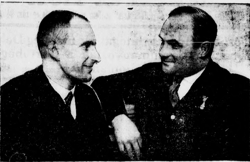
Két világhírű oceanrepülő: Von Gronau és Köhl kapitány.