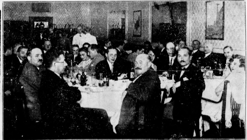
Az Okleveles Gyógyszerészek Országos Egyesületének közgyűlése alkalmából az Angol Királynőben rendezett bankett résztvevőinek egy csoportja.

tett 64, meghalt 1064 egyén, így a természetes szaporodás 759 lélek volt. A gümökórban 137 egyén halt meg, úgyhogy minden nyolcadik halott gümökórban szenvedett ki. A Stefánia-szövetség Vámospércsen új védő intézetet állított fel, amelynek támogatására az alispán nyolcezer pengőt utalt ki. Örömmel emlékezett meg a jelentés arról, hogy Górgéy Márton tisztifőorvos odaadó munkájának eredményeképpen a bodai golyvások 82 százaléka meggyógyult és Tiszacsegén 92 százalékos gyógyulás mutatkozik.