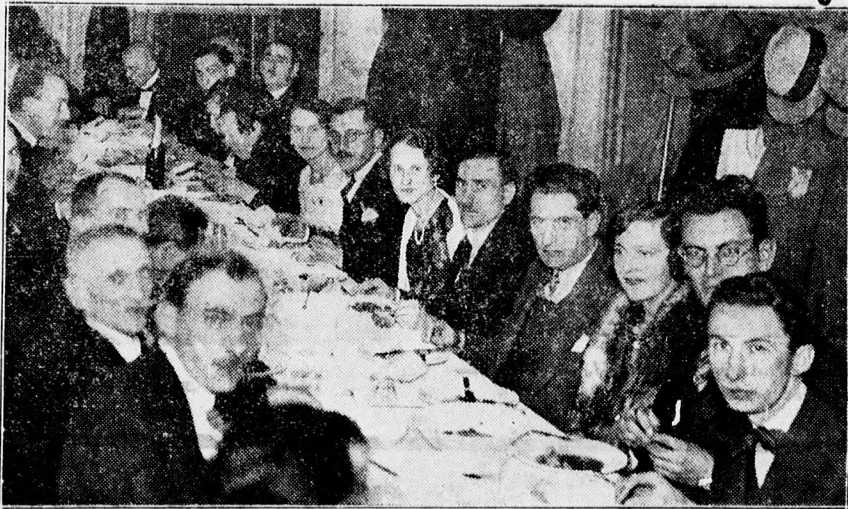
A DKAE ünnepi vacsorája résztvevőinek egy csoportja.

10 órakor kezdődött a templomban az ünnepi istentisztelet. A 227. dicséret 1. és 2. versének elneklése után az egyházmegye kiküldött lelkésze, Bán István esperes helyettes és az új lelkész az urasztala elé léptek. Az espereshelyettes gondolatokban gazdag beszédben vázolta az új lelkész és a gyülekezet kö-