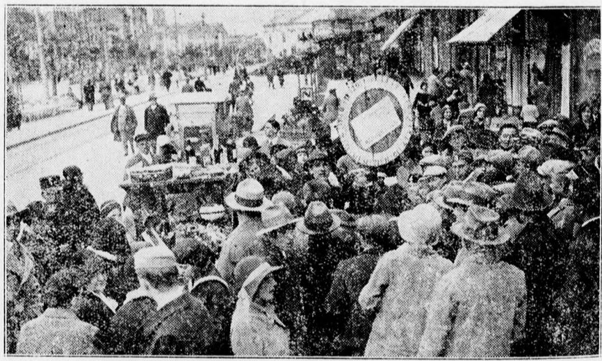
A Patronage Egyesület gyűjtése. — Az egyik szerencsekerék a Passage előtt.

LEGJOBB HIRDETÉSI ORGANUM A DEBRECENI FUGGETLEN UJSÁG.