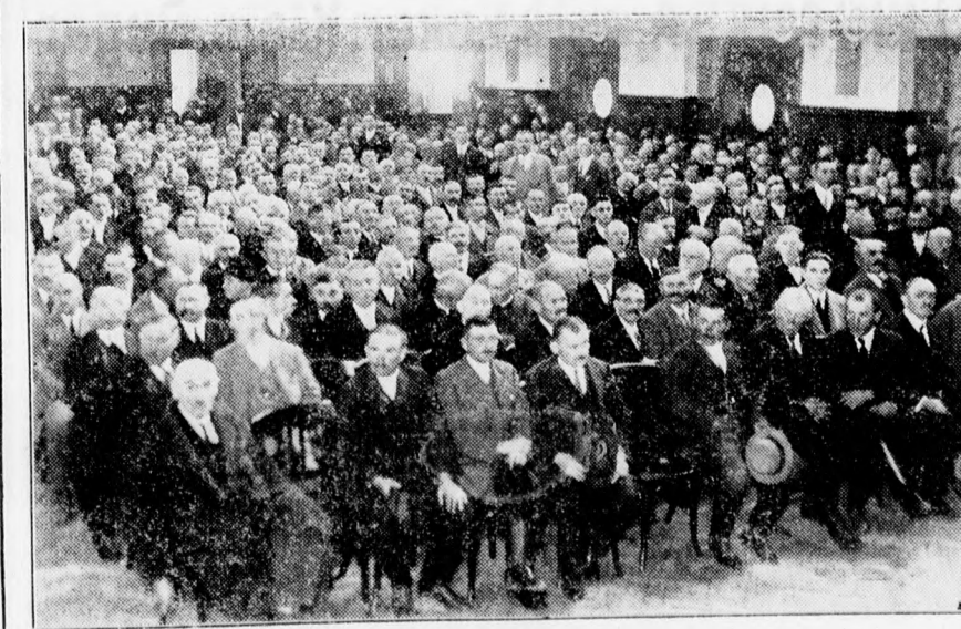
A gazdakongresszus résztvevői az Arany Bika disztermében.

Kifejti ezután a szónok, hogy a gazdatársadalom ellenük van azoknak, akik itt defetizmust