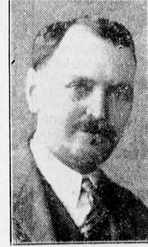
Dr. Juhász Nagy S.

kodott volna. A Debreceni Független Ujság munkatársa éppen ezért szükségesnek tartotta felkeresni Juhász Nagy Sándor volt igazságügyi minisztert, hogy felvilágosítást kérjen a földműves mozgalmakról ettől a tiszta jellemű, kiváló képességű és bátor meggyőződésű politikustól, aki kora ifjúsága óta törhetetlen küzdelmet folytatott és jeltéért. Juhász Nagy Sándor — bár elveit üldöztetést is szenvedett