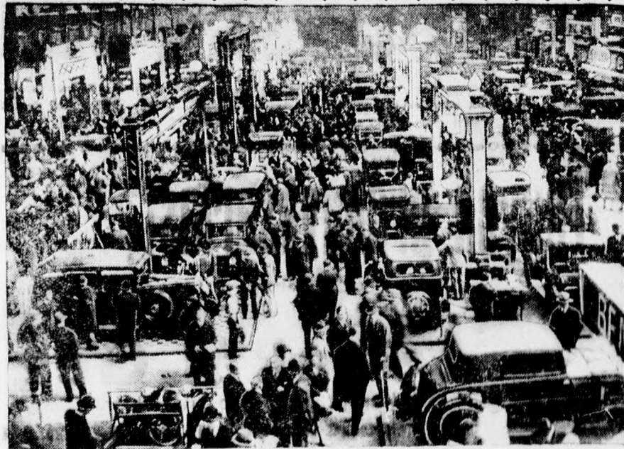
A londoni nemzetközi autókiallítás képe.

Erre a lépcsőházban helyezték el a leány holttestét, amelyet a házmester