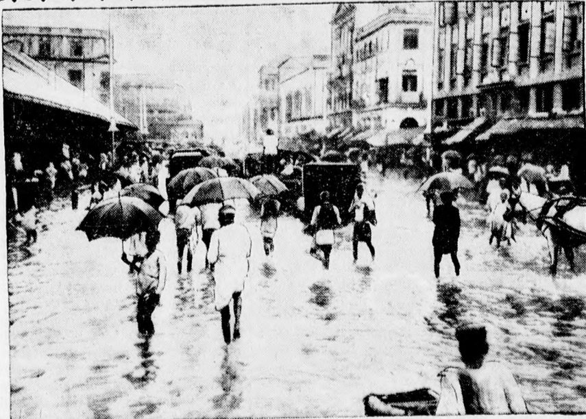
Bombayban olyan hatalmas esőzések voltak, hogy a víz elöntötte az uccákat s az emberek majdnem térdig jártak az uccán a vízben.

A szerencsétlenség okát mindezeideig nem sikerült megállapítani.