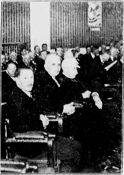
A kereskedelmi és iparkamara Magyar Hét diszülése résztvevőinek egy csoportja.

A leány nem adott határozott választ, mire a leány elkapta a vasvilágítást és alaposan elverte a macskakodó leányt, úgy, hogy eszméletlenül terült el a földön.