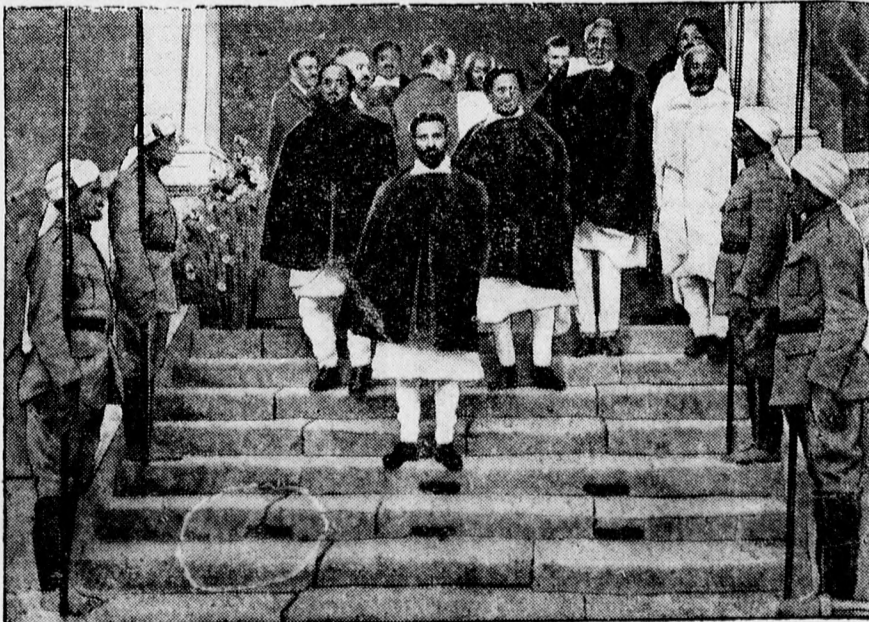
Nas Tafari, az abessziniai királyi kormányzó hivatalos látogatás után távozik az addis abebai német követőtől.