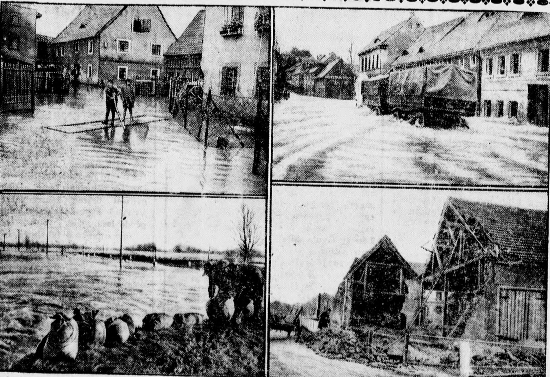
A szilészi árvíz. Baloldalon fenn: Elmes gyermekek az ajtókat használják tutajoknak. — Jobboldalon fenn: Megrakott teherautó igyekszik átjutni az elöntött úccán. — Lenn baloldalon: A partokat homokzsákokkal igyekeznek megerősíteni. Lenn jobbra: Beomlott házak az árvízöntötte területeken.