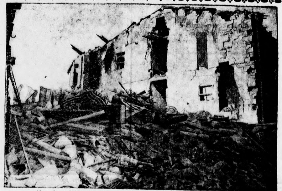
Az olasz földrengés pusztításai. Rombadólt házak Senigalliában.