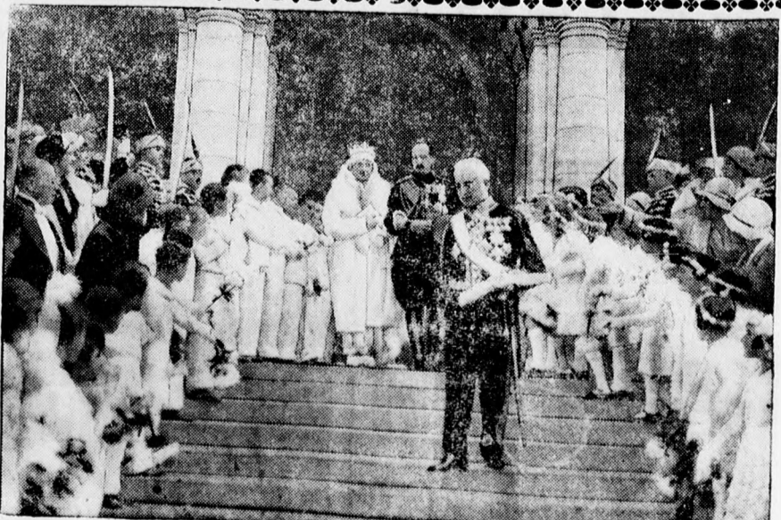
A bolgár királyi pár elhagyja az Alexander Newski katedrális Szófiában az óhítu ritus szerint történt áldás után.

elővételben elkelt. A nagy érdeklődést indokolni látszik az Abrányi Emil mester keze által vezetett filharmonikus együttes iránti bizalom és szereteten