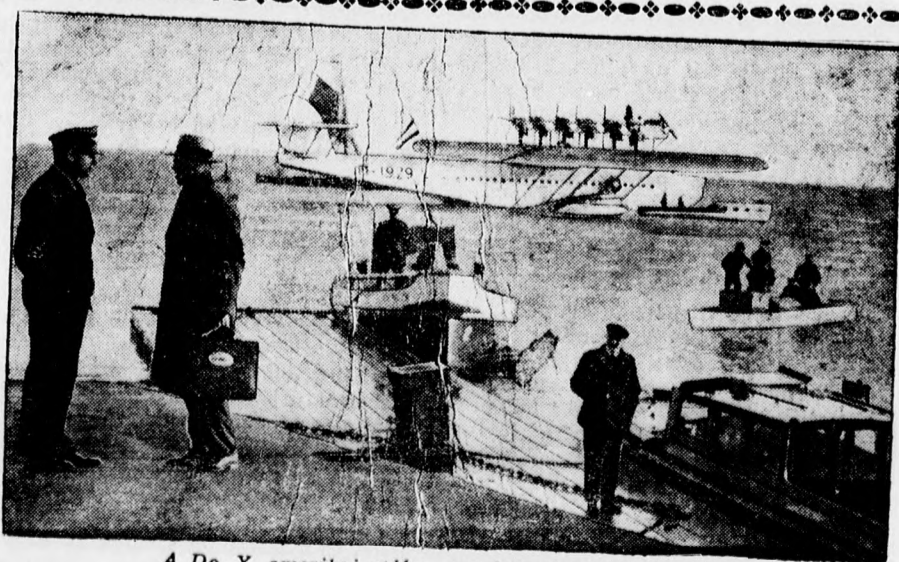
A Do. X. amerikai utján megérkezik Southamptonbe.