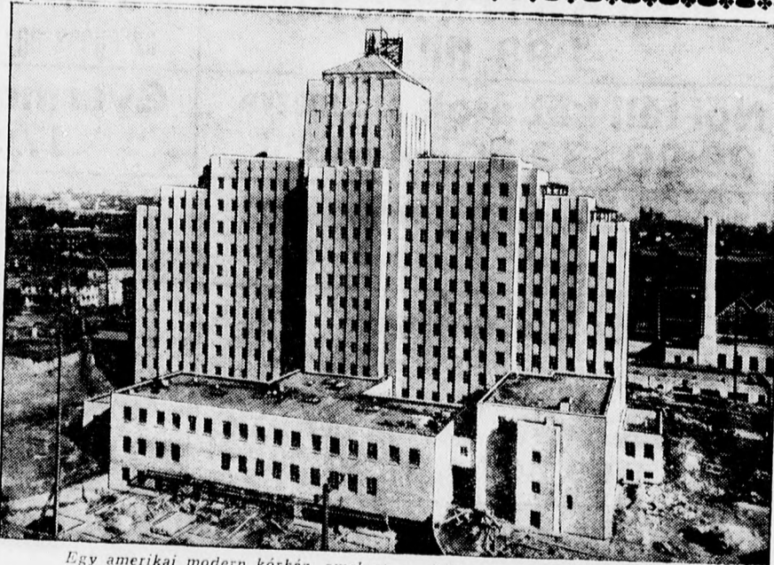
Egy amerikai modern kórház, amelyet a kórházak ideáljának tartanak.

Az összes megjelenő szépirodalmi újdonságok, tudományos és ifjúsági könyvek a megjelenés után azonnal kaphatók a Debreceni Független Ujság Kölcsonkönyvtárában.