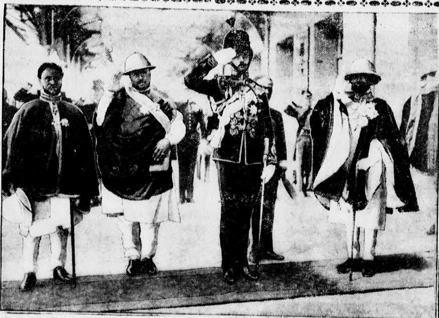
A gloucesteri herceg, az angol király harmadik fia (angol huszár egyenruhában) az abessziniai királykoronázáson.

A magyar színészetnek csak akkor volt még ilyen szomorú a helyzete, mikor még ekhös szekereken járták az or-