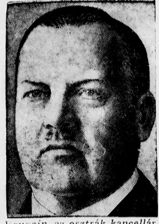
Vaugin, az osztrák kancellár.