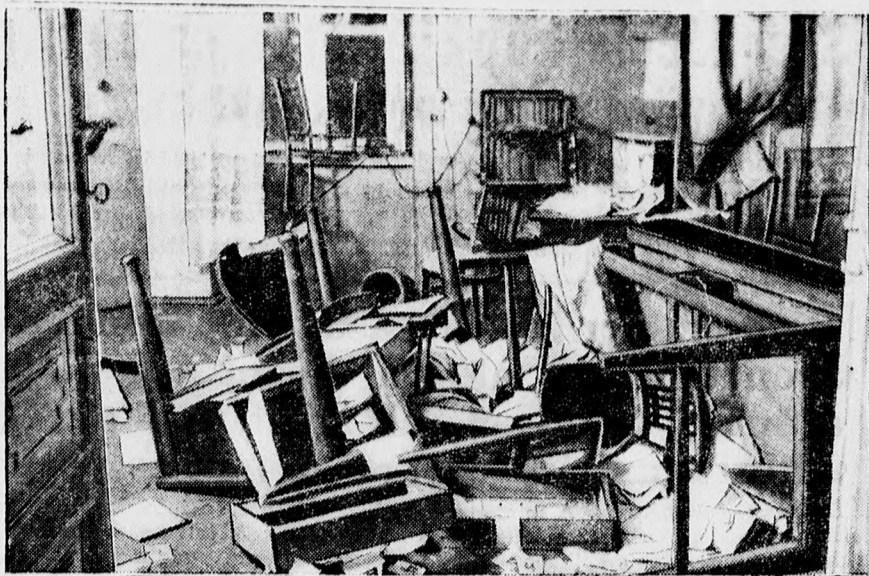
Lengyelországban dühög a választási terror. Képiünk a varsói nemzeti demokrata párt feladott irodáját mutatja.

LEGJOBB HIRDETÉSI ORGANUM A DEBRECENI FUGGETLEN UJSÁG.