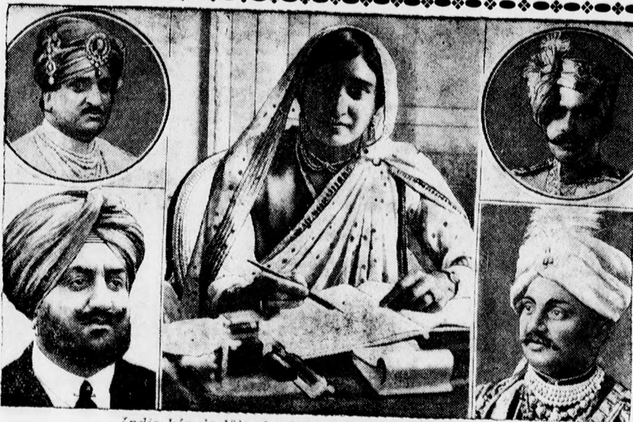
India képviselői a londoni kereszatal konferencián.

Az elfogott szélhámos eleinte London-ban is folytatta azt a könnyelmű életét, amit Budapesten, a legjobb szállodák-ban lakott. Pénze azonban hamarosan elfogyott, mert nemrégiben