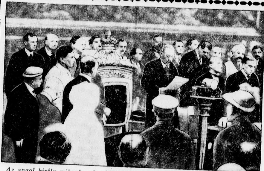
Az angol király mikrofon és rádióképviteli gép előtt felolvassa az indiai konferenciát megnyitó beszédét.