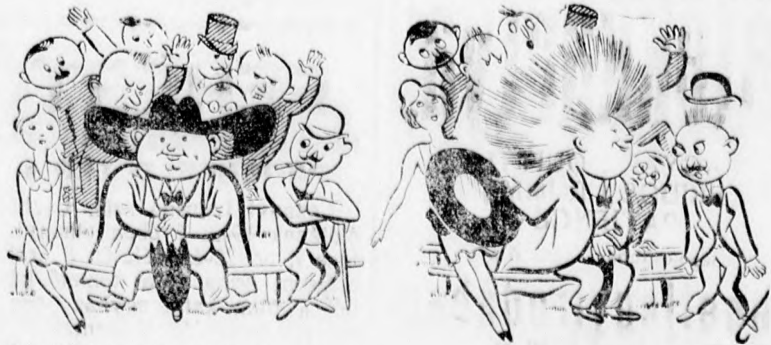
— Tessék levenni a kalapot.

A DEBRECENI FUGGETLEN UJSAG. LEGJOBB HIRDETÉSI ORGANUM