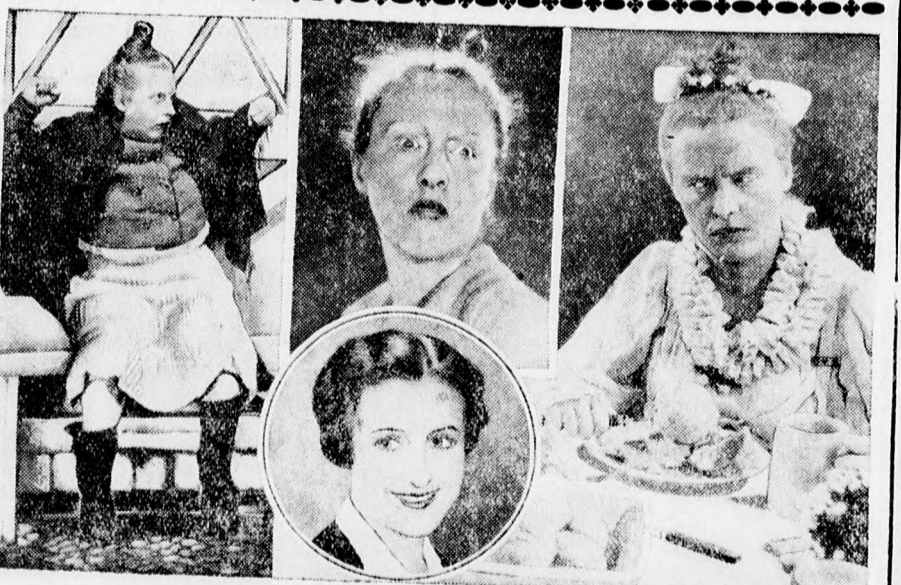
A szép és a csunya Henny Porten.

Ezek után még csak annyit, hogy az, aki valaha Magyarországról mint Ázsiáról emlékezett meg, az nem volt más, mint... maga Karl Hans Strobl.