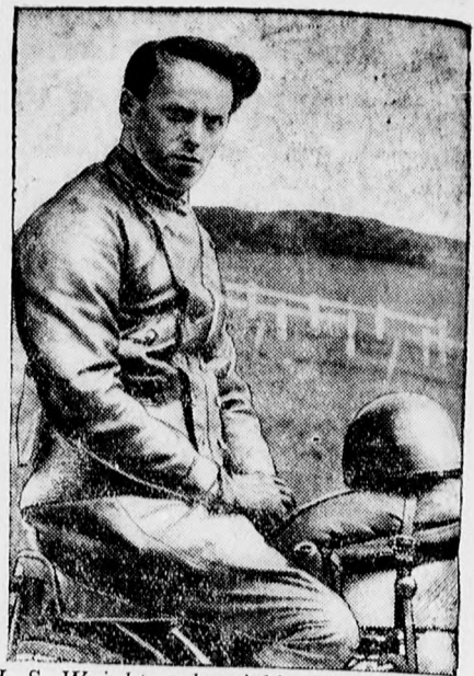
I. S. Wright, a legújabb motoros világbajnok.

gorajáték. 8: Hangverseny. 9.25: Operarészletek. Majd: Zenekar. Kassa. 11.30: Gramofon. 12.30: Jazz-band. 9: Rádiózenekar. Utána: Prága. Prága. 11.15: Gramofon. 7: Hangverseny. 7.35: Tarka óra. 10.25: Zene. Zürich. 4: Zene. 4.45: Gramofon. 5.15: Harmonikaszeptett. 5.50: Gramofon. 10: Tángramofon.