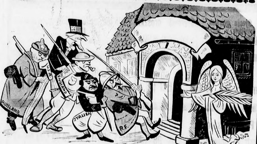
A LESZERELŐ NAGYHATALMAK A BÉKEPALOTA ELŐTT: A békeangyal: Tessék, tessék uraim!

— A Kereskedők és Utazók Egyesülete szombaton tartotta meg családias jellegű összejövetelét. Az összejövetel nagyon szépen sikerült, a tagok nagy része megjelent és a fiatalok az összejövetel családias jellegét egy kis műsorral és tánccal tarkította.