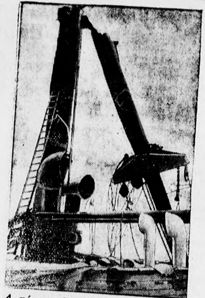
A német „Baden” cirkáló árboca, amelyet a braziliai felkelők lelőttek.

Hálózati rádió 175 pengőtől Phillips rádió legolcsóbban KESZLER cégnél kaphatók Széchenyi u. 1.