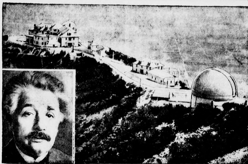
Einstein Amerikába utazik. Lenn: Einstein. — Jobbra: A Mount Wilson obszervatórium Kaliforniában, ahol Einstein professzor, teóriájának bebizonyításán akar dolgozni.