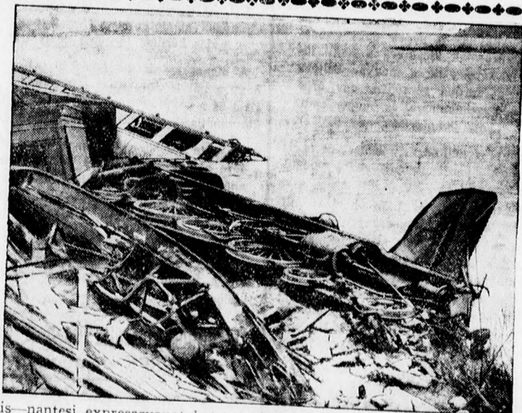
A páris—nantesi expresszvonat kataszt rófája. A vonat romjai a Loire partján.

Debrecen város Iskolán kívüli Népművelési Bizottsága — mint a múltban, úgy a most közzelgő tél folyamán is — tanfolyamokat rendez az irni, olvasni nem tudók számára s ezúton fordul városunk nagyközönségéhez, gyárak, üzemek vezetőségéhez, hogy anaalfabéta alkalmazottjait, vagy ismerőseiket írásban, vagy személyesen jelentsék be a Népművelési Bizottság titkári hivatalában (Miklós u. 23. sz. alatt), illetőleg buzdítsák az illetőket a jelentkezésre. A tanfolyamok három hónapig tartanak és pedig az esti órákban, hogy a hallgatók napi foglalkozásukban akadályozva ne legyenek. A tanfolyamok teljesen ingyenesek s azok végeztével az illetők hivatalos bizonyítványt nyernek. Jelentkezni lehet a már említett helyen naponként délelőtt 9—1-ig, délután 4—6 óráig. A tanfolyamok a megfelelő számú jelentkezés sorrendjében kezdődnek, miért is kívánatos, hogy az illetékesek mielőbb jelentkeznek be az azokon való részvételükért.